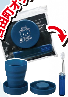
「携帯 エチケットセット」