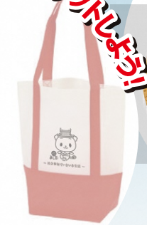
「オリジナルトートバッグ」