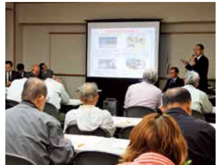
▲地区ごとに開かれた報告会では、スクリーンを使って昨年度決算などを説明