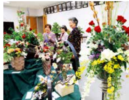
▲地域住民から寄せられた趣味や習い事などの作品が並んだ北区自強館

北区文化展(北区自治会主催)が11月11日、12日の両日、北区自強館で開かれ、1,000人を超える来場者が文化芸術に親しみました。地元住民から寄せられた華道や写真、絵画、書道、手芸など幅広いジャンルの作品約600点が展示され、地元住民などによる歌のコンサートや大正琴、腹話術、マジックショーといった多彩なプログラムが文化展を盛り上げました。そのほか似顔絵や書のプレゼントが人気を集め、文化展に華を添えました。文化展に出品した人たちは「自分の作品を見てもらえるとうれしい。こういう機会があると励みになる」と話していました。