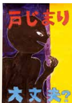
ひらのゆうと 平野優冬 (自彊小5年) 「戸じまり大丈夫?」