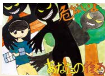
おおいしりり 大石凜々 (中央小6年) 「危ないよ、あなたの後ろ」