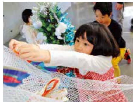
▲それぞれが作ったクリスマス飾りを引っかけ、手作りのクリスマスツリーを完成