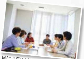
月に1回は相談員全員が集まって情報交換をしています。

介護相談員は介護保険施設などを訪問し、利用者から介護サービスに関する疑問や要望、相談を受けて利用者と行政、サービス事業所をつなぐ橋渡し役になります。 吉田町では看護師やケアマネジャーなどの資格を持った人やさまざまな分野で経験を積んだ8人の介護相談員が活躍。2人1組で介護保険施設などを月1回程度訪問し、利用者の声を聞いて問題解決に向けた手助けをしています。介護保険を利用している人の中には、施設の対応やサービスについて疑問や要望、心配ごとなどを抱えている人がいるかもしれません。個人情報を守るため何でも気軽に相談してください。