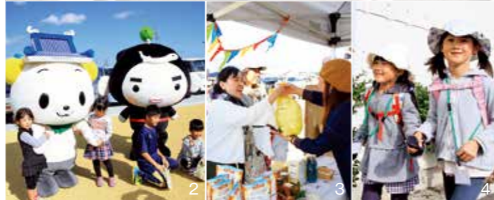
1_コースごとに参加者たちが元気よくウォーキングをスタート 2_町のPR部長よし吉と町商工会公式キャラクターウレシ丸はどこでも人気者 3_オーガニックフェスタで買い物を楽しむ来場者 4_子どもたちもウォーキングに参加