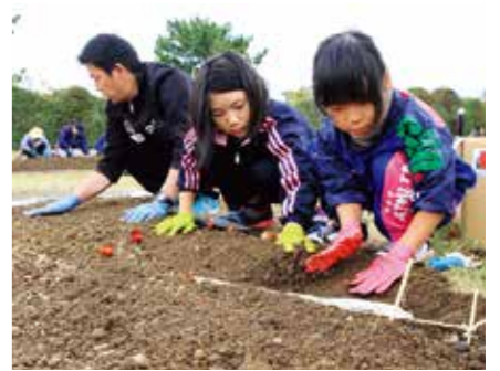
▲シャベルを使って土を掘り、丁寧に球根を植えていく参加者

県営吉田公園で11月12日、来春のチューリップまつり開催に向けてチューリップの植栽が行われました。当日は町内外から職場仲間や家族連れなど約260人が参加し、60品種約10万球の球根を植え付け。参加者は球根を植える向きや深さなど、スタッフの指導を受けながら一つ一つ丁寧に植えていました。花壇は、赤、黄、紫などカラフルな水玉模様をデザイン。キャンディープリンセスを中心に、八重咲きのアバオレンジや紫に白い縁取りのシネエダブルーなど珍しい品種も多数植えられ、来年4月上旬には満開のチューリップ畑が訪れる人たちを出迎えます。