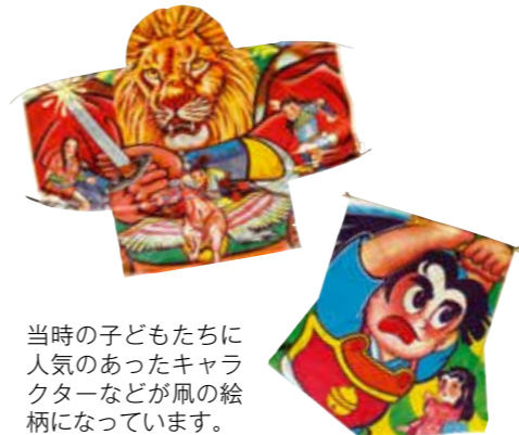
当時の子どもたちに人気のあったキャラクターなどが風の絵柄になっています。

今年も珍しい「風」の展示を行います。今回は昔懐かしいマンガやアニメキャラクターが描かれた風など約50点を展示します。彩り豊かな色彩で描かれた昭和の風をぜひ楽しんでください。