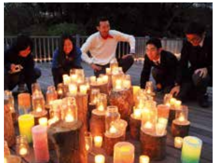
▲告白タイムの会場にろうそくを飾り、イルミネーションを完成させる商工会青年部