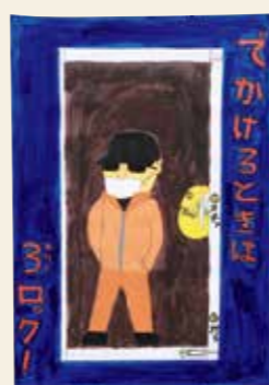
はせがわゆうと 長谷川優翔 (住吉小6年) 「でかけるときは3ロック!」