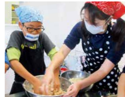
▲ゆでた大豆をつぶし、塩や糀を加えて丁寧に混ぜ合わせる参加者