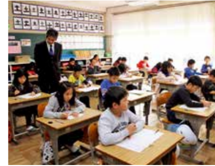
▲テストを前に、担任の先生から注意事項など説明を受ける児童