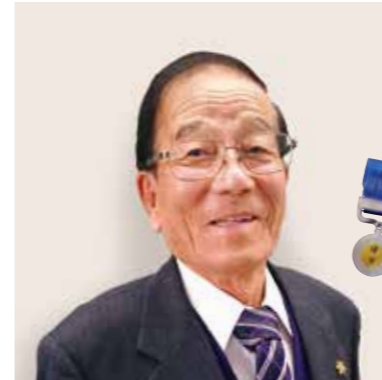
元牧之原警察署 地域安全協議会長