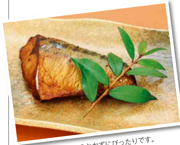
お弁当のおかずにとぴったりです。

鯖は県内でも水揚げされ、一般的には「ごまさば」が多く出回っています。「ごまさば」は年間を通してあまり味が落ちませんが、これからの季節が一番おいしく食べられます。またDHA(ドコサヘキサエン酸)やEPA(エイコサペンタエン酸)などが豊富に含まれているので、血液中のコレステロールや中性脂肪を減らす効果があり生活習慣病予防にもぴったりです。特に血合いにはビタミンやミネラルが多く含まれているので積極的に食べたいですね。今回は、鯖をカレー風味に漬けてこんでから焼くことで魚の臭みが抑えられ食べやすくなっています。