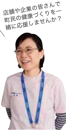
皆さんで店舗や企業の健康づくりを一緒に応援しませんか？

ふじのくに健康いきいきカードに協力いただける町内の店舗や企業、施設などを募集しています。割引やポイントの2倍、ドリンク1杯無料など提供していただくサービス内容は協力店が独自に決めることができます。無理のない範囲で協力をお願いします。申し込みは、健康づくり課に備え付けの申込書に必要事項を記入して提出してください。申込書は町ホームページからダウンロードすることもできます。