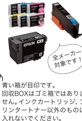
青い箱が目印です。回収BOXはゴミ箱ではありません。インクカートリッジ、プリンタートナー以外のものは入れないでください。