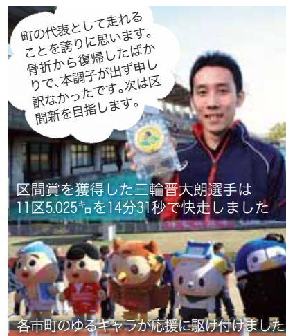
町の代表として走れることを誇りに思います。骨折から復帰したばかりで、本調子が出ず申し訳なかったです。次は区間新を目指します。

県内全35市町から39チーム（市の部に23市27チーム、町の部に12町12チーム）が出場した今大会は、風のないベストコンディションの中、午前10時の号砲とともに県庁前をスタート。選手たちはふるさとの誇りと町民の大きな期待を背負い、県営草薙陸上競技場までの11区間、42.195kmを懸命にたすきをつなぎ、熱い戦いを繰り広げました。