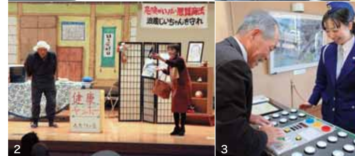
1 交通指導員勤続や防犯活動などの功労者を表彰 2 名演技で会場を沸かせ、だまされないコツを楽しく教える浪蔵劇団 3 ロビーでは来場者がもぐらたたきの要領で俊敏性をチェックするクイックアームに挑戦