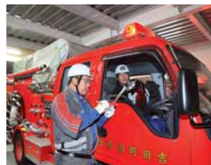
▲夜警の出発の前に、気を引き締めて車両などを点検