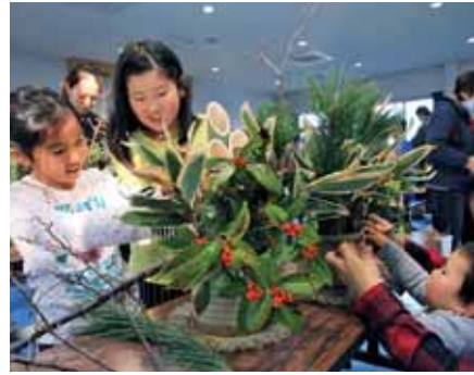
▲バランスを見ながら松やセンリョウなど飾り付けを楽しむ参加者