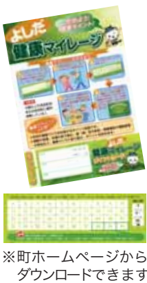
※町ホームページからダウンロードできます。

よしだ健康マイレージは、毎日の運動や食事などの生活改善に取り組んだり、健（検）診の受診、健康講座や運動教室に参加したりすることでポイントを集めていきます。自分に合わせた健康づくりで40ポイントたまったら、ポイントカードを保健センターに提出し、「ふじのくに健康いきいきカード（県発行）」と交換。カードを提示すると、県内の「ふじのくに健康いきいきカード協力店」でさまざまな