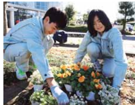
▲配色を考えながら丁寧に花の苗を植え付ける吉田特別支援学校の生徒