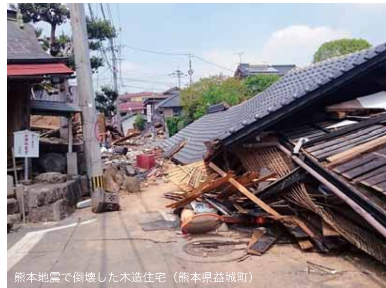
熊本地震で倒壊した木造住宅（熊本県益城町）

町では、木造住宅の耐震化を図り、町民の皆さんの生命と財産を守るため耐震補強工事の補助制度を設けています。昨年4月14日に発生した熊本地震を震源とする地震では、昭和56年5月以前の建築基準で建てられた木造建築物が数多く倒壊し、尊い命が奪われました。地震は近年、全国で活動期といわれ、いつどこで起きてもおかしくありません。住宅の耐震化をさらに加速させるため、平成30年3月末までの期間限定で、補助金の上限額を最大30万円まで増額することになりました。期間が限られていますので、ぜひこの機会に耐震補強工事を考えてみてはいかがでしょうか？