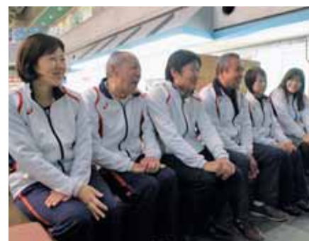
▲田村町長に受賞の喜びを報告する町スポーツ推進委員メンバー