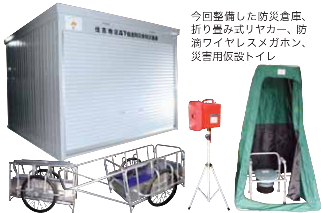
今回整備した防災倉庫、折り畳み式リヤカー、防滴ワイヤレスメガホン、災害用仮設トイレ