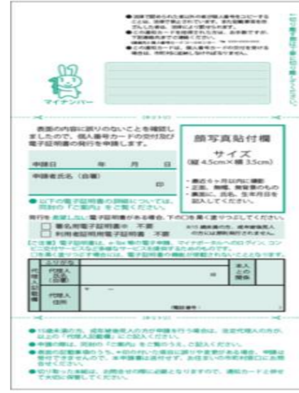
个人编号交付通知书