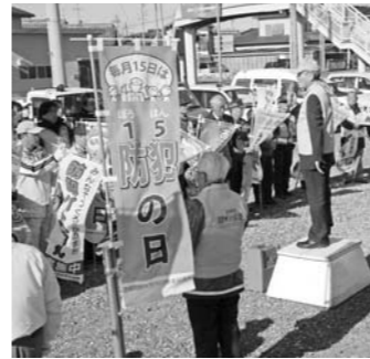
安心安全なまちづくりを誓う参加者

吉田町防犯まちづくり推進協議会は、今年から毎月15日を「防犯の日」と制定し、吉田町を「犯罪に遭いにくいまち」にするため、防犯パトロールのぼり旗を掲げるなど、町民の防犯意識を高める活動を行います。