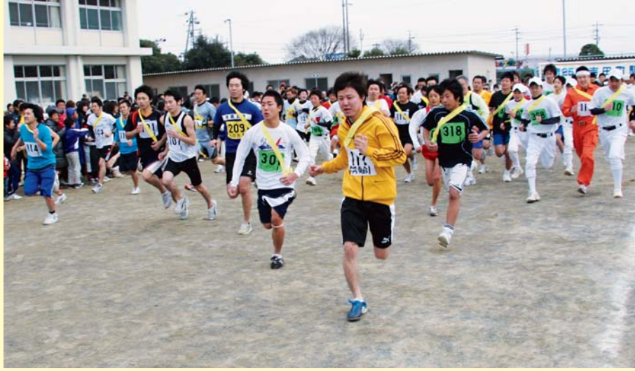
号砲とともに一斉にスタートする選手の皆さん