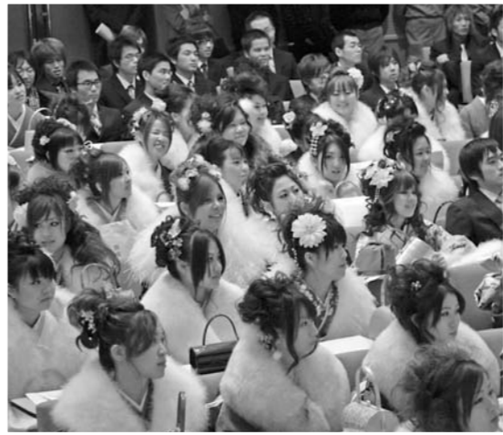
大人としての決意を新たにした新成人の皆さん

1月11日、吉田町学習ホールでは、色鮮やかな振り袖や初々しいスーツを身にまとった新成人の皆さんが、なつかしい友人との再会に歓声をあげていました。