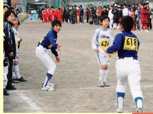
多くの声援の中、全チームが最後までたすきをつなぎました