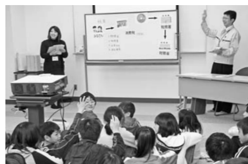
役場税務課職員から税金の使い道を教わる児童

の仕組みなどの説明を真剣にまなざしで楽しみながら学んでいました。また、「どんな税金の種類があるか」や「大切な税金はどのように使われているか」など職員が質問をすると、児童たちは、積極的に手を上げて答えていました。