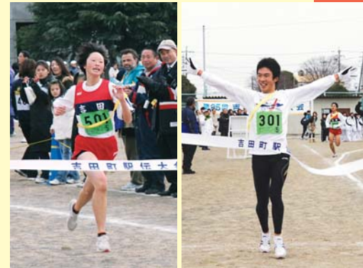
女子コース優勝「吉田中陸上部A」（左） 男子コース優勝「オジリアン」