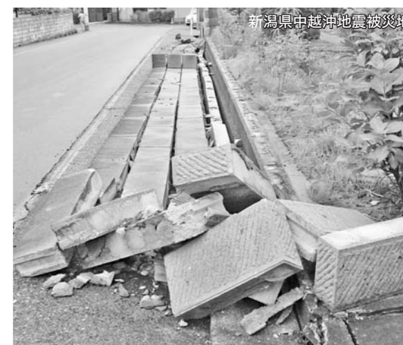
新潟県中越沖地震被災地

補助額…撤去にかかる費用と撤去するブロック塀の延長に基準額（1mあたり8,900円）をかけたものとを比較して、いずれか少ない額の2分の1以内（1敷地につき上限50,000円）