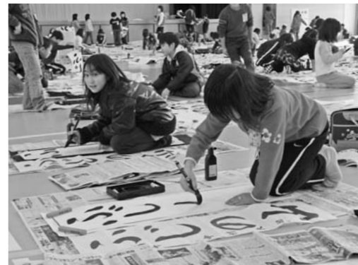
一字一字思いを込めて書く児童たち (中央小)