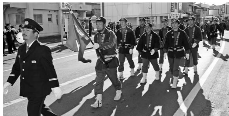
威風堂々と分列行進をする消防団員たち