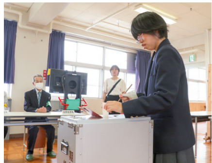
▲実際の投票会場と同じように設けられた教室で、模擬投票を体験する生徒