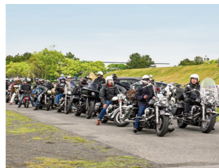
▲県内外から自慢の愛車と共に集まり、交流を楽しむバイカーたち

県内外からバイク好きが集まるキャンプミーティングイベント「バイズインディペンデンスデイ」が4月25日・26日の2日間、県営吉田公園西側町有地で開催されました。会場には物販や飲食など、地元事業者を含む40のブースが出店したほか、小山城太鼓保存会やダンススタジオ Cheese!! がパフォーマンスを披露し、イベントを盛り上げました。町での開催は昨年を引き続き2回目。バイク参加以外の一般来場は無料で、当日は地元からもたくさんの方が来場し、バイク見学や参加者との交流、買い物を楽しんでいました。