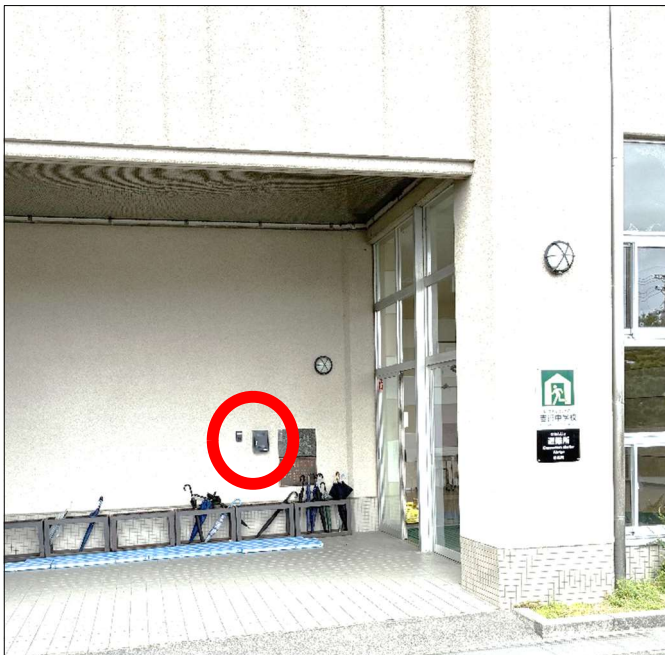
吉田中学校(第一アリーナ入口左側)