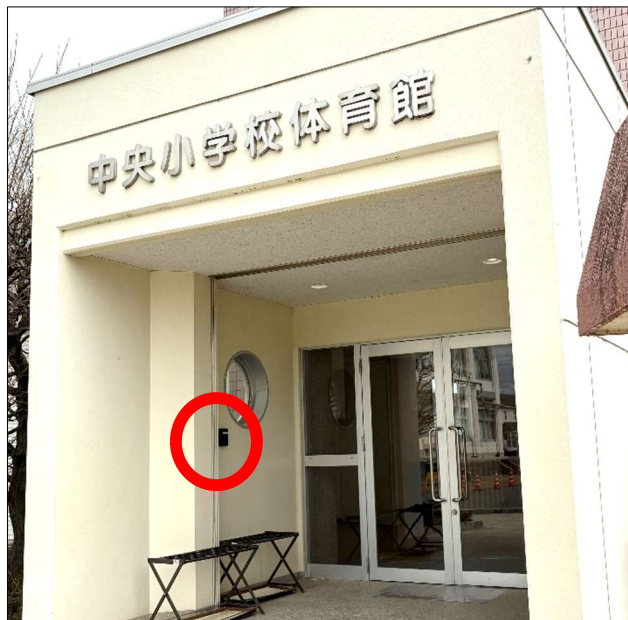
中央小学校(えんぴつ門側入口左側)