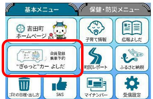
▲ LINEの「基本メニュー」画面