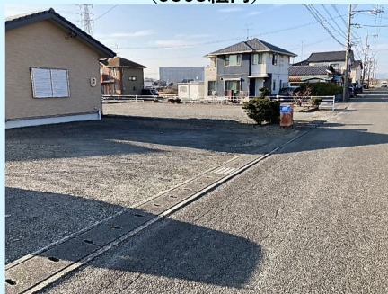
片岡31_赤堀歯科医院