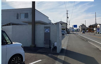
片岡32_山城屋製茶工場東駐車場