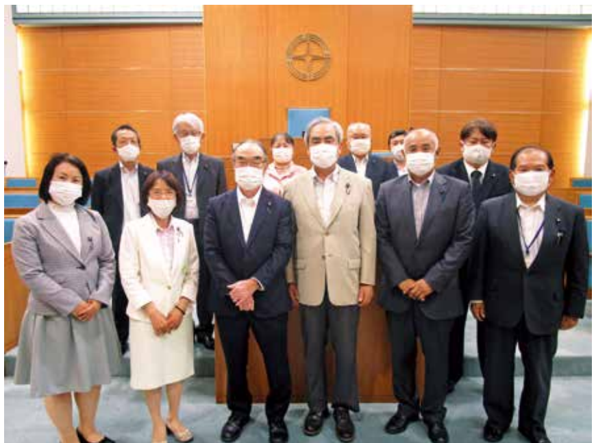
福世議員につきましては、撮影時不在のため、掲載しておりません。