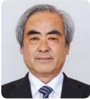
副議長 平野 積