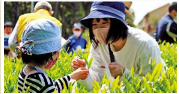
4地区合同地域教育推進協議会「茶摘みでGO」