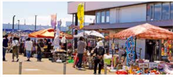
オアシスマルシェin北オアシスパーク