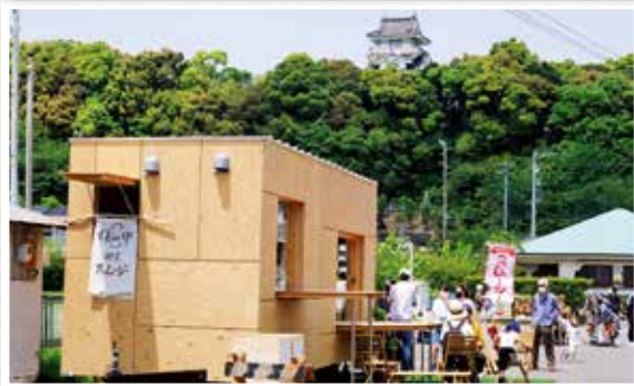
「小山城前アンテナショップ」オープン