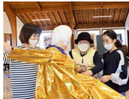
▲家族で協力し、骨組みに好みの服を着せ楽しみながらかかしを制作