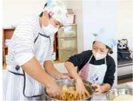
▲親子で協力し、つぶした大豆とこうじを一生懸命混ぜ合わせる参加者