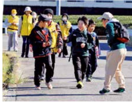
▲スタッフや友達と楽しく話をしながら地元を探検する子どもたち