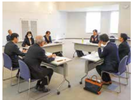
▲町からの報告を受け、教育大綱の素案について議論する教育委員