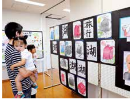
▲約300人が文化展に出品。ずらりと並んだ作品を楽しむ来場者