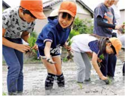
▲スタッフにコツを学びながら、もち米の苗を5~6本に分けて植え付け