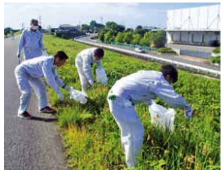
▲2班に分かれ、大井川河川堤防敷のゴミを拾い集める参加者たち