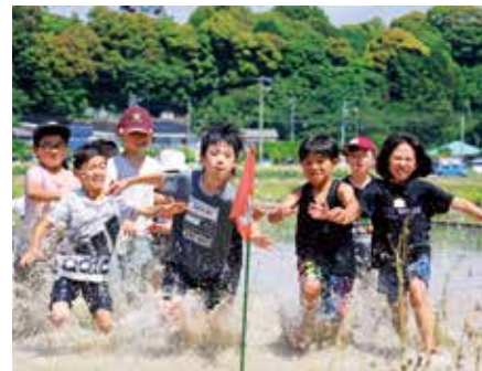
▲泥だらけになりながら田んぼに立てた旗を目指し走る子どもたち