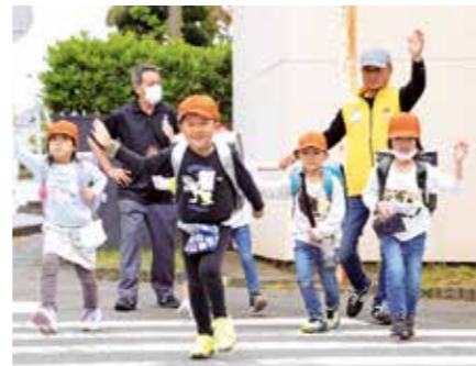
▲横断歩道の渡り方や交通ルールなどを教える町学校応援団

交通ルールに慣れていない新1年生の下校をサポートしようと町学校応援団は、住吉小1年生の下校に付き添うなどの見守り活動を行いました。学校からの依頼を受け、自治会役員や民生委員などが4月13日から約3週間、4~5人のグループに分かれて道路の歩き方や横断歩道の渡り方など交通ルールを教えながら保護者が待つ引き渡し場所まで送り届けました。メンバーは「道路を横断するときは真っすぐに手を上げ、必ず止まって左右と後ろを確認するの忘れないで」「車道に飛び出さないようにね」などと児童たちに呼び掛けていました。