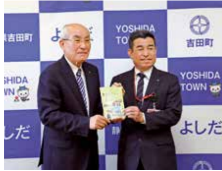
▲完成報告会終了後に大村地区統括局長(右)と田村町長が記念撮影