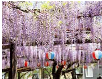
▲甘い香りを漂わせ、来場者を楽しませた林泉寺の長藤