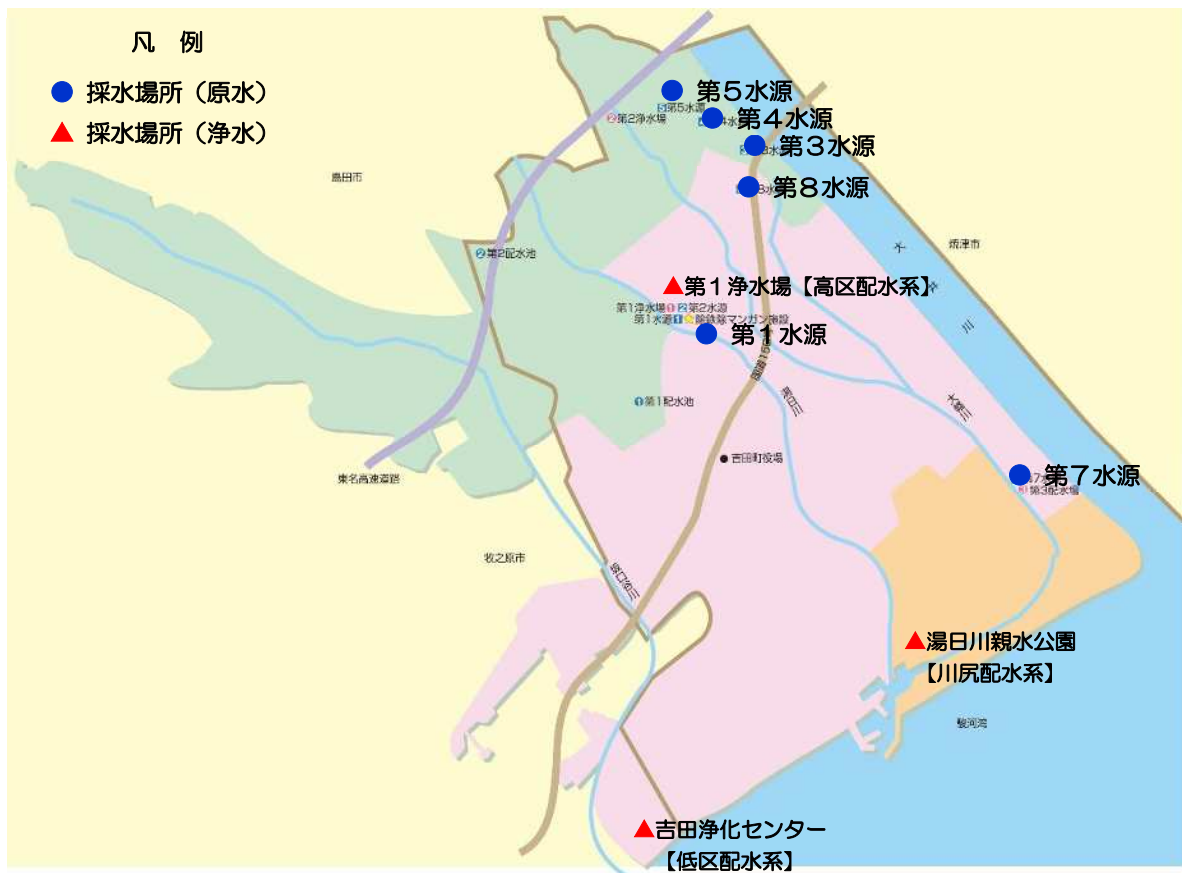
図2 原水・浄水の採水場所

また、消毒用の残留塩素濃度を適切な値を確保するために、各浄水場及び配水場に設置している計測器において、監視を行います。