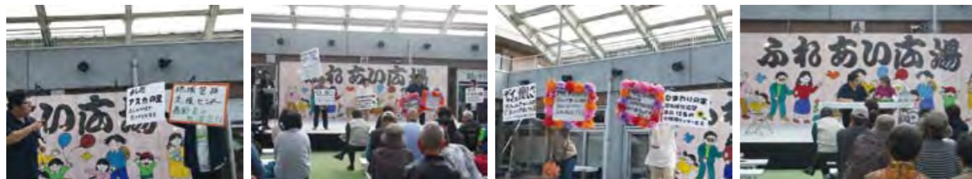
地域イベント（ふれあいの広場）