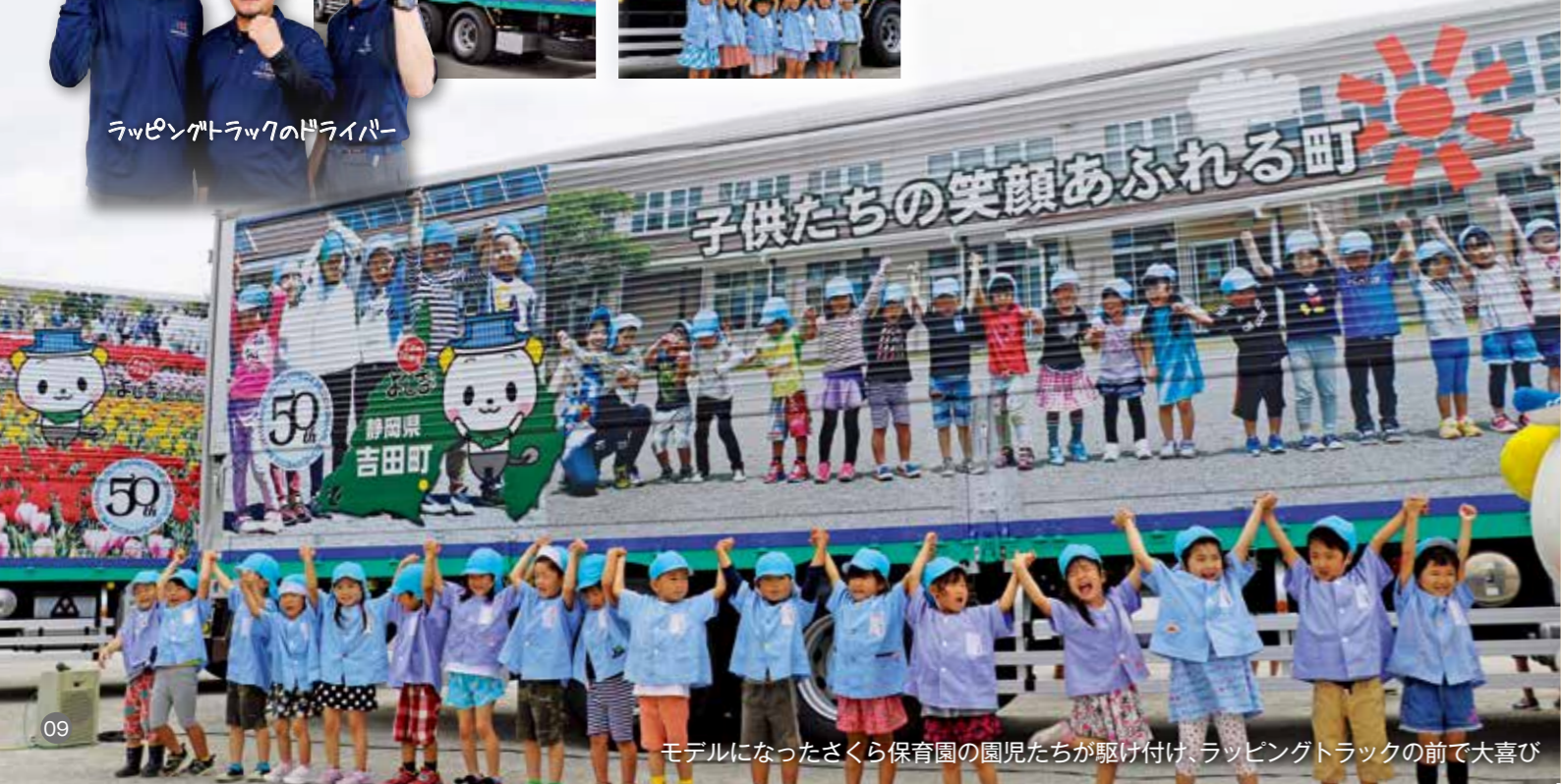
モデルになったさくら保育園の園児たちが駆け付け、ラッピングトラックの前で大喜び