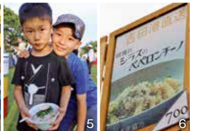
1、2ミュージシャンの登場に大勢の来場者が盛り上がるステージ 3昨年からよし吉も仲間入り。オリジナル缶バッジが手に入る大人気のチャリティーガチャポン 4スタッフが作成した手作りタイムテーブルの前でピース！ 5、6シラス丼やパスタなど吉田特産のシラスを使ったメニューも人気