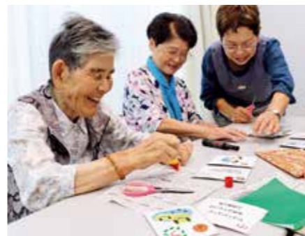
▲折り紙をちぎって貼ったりペンで塗ったりしてかるたを飾り付ける利用者