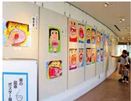
▲6月12日から26日までの15日間、町立図書館に展示されたポスター