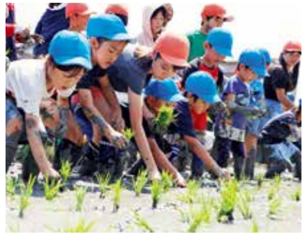
▲上級生と下級生のペアで1列ずつ丁寧に苗を植え付け