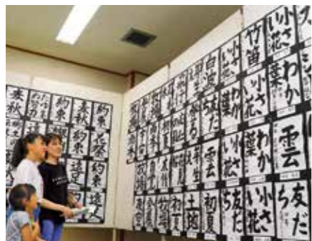
▲住民自慢の作品が並ぶ会館内で、友達や家族の作品を眺める来場者