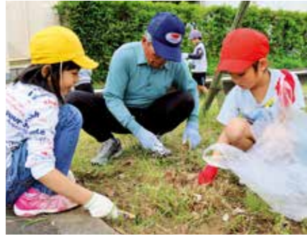
▲軍手をはめ、鎌を使って草取りに励むさわやかクラブメンバーと児童たち