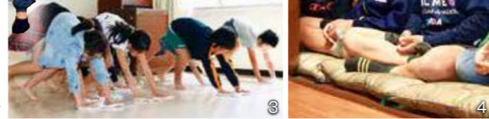
肝試しではゾンビコンテストが開催され、本格的なゾンビがたくさん出場。