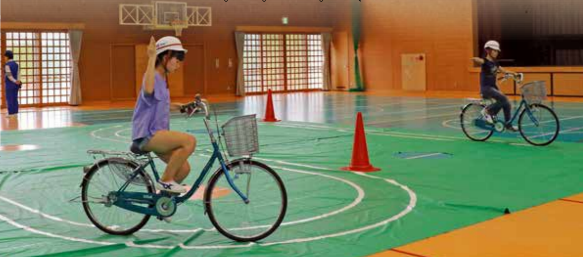
1交通安全協会委員から指導を受ける放課後練習 2ピンを使って腕とももの筋トレも欠かさない 3練習前のストレッチでリラックス 4真剣な表情で黙々と練習 5学科の勉強も毎日頑張る選手たち

放 課後、選手たちはぞくぞくと体育館に集まってきました。ピンを並べシートを敷き、指導者が来なくても自分たちでどんどん練習を始める自主性の高いやる気あふれる選手集団。互いに足りないところを指摘し合い、地道に技を磨き合っています。 住吉小は平成21年から地区大会で連覇する優勝常連校。そこには、毎年6年生から5年生へと受け継がれる伝統とプライドがあります。地区大会では「自分たちの代で連覇を止められない」と4月から練習に励んできました。次は県大会、三ヶ日西小や平山小など県西部はここ数年優勝を争うつわもの揃い。そんな強豪チーム相手に入賞を狙う住吉小は、ほぼ毎日の放課後はもちろん、朝も昼休みも20分の休み時間まで遊びたい気持ちを我慢して練習に取り組んでいます。放課後にいつも指導してくれる交通指導員や交通安全協会の皆さんに感謝しながら「3位以内入賞」を目標に、今日も全員で「一歩先へ」。