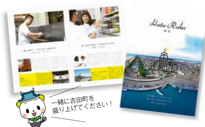
一緒に吉田町を盛り上げてください！

町では、企業や団体などが実施する「町の魅力情報発信」や「吉田町PR部長よし吉認知度向上」「結婚支援」の取り組みに対して補助金を交付し、さまざまな主体が取り組む町のにぎわいづくりをサポートします。 昨年度には、この補助金を活用し、県営吉田公園を会場とした婚活イベント「ピク婚」が開かれたほか、町内の魅力あふれる職業や店舗を紹介する情報誌「旗楽（E-Raku）」が発行されました。