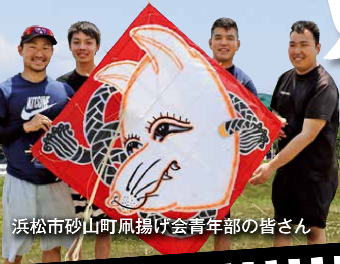
浜松市砂山町凧揚げ会青年部の皆さん

ネットで検索して遊びに来ました。できるだけ外で遊ばせたいからこういうイベントはありがたいですね。子どもたちは最初、行きたくないって言うていたけど、凧揚げに夢中で、お菓子ももらえてとても喜んでます。最近では凧揚げできる場所がなかなかないんですよ。今日は参加して良かったです。