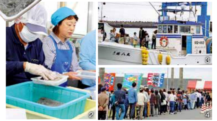
1_来場者が行列を作って生シラスを購入/2_水揚げされた生シラスのパック詰め作業で大忙し/3_シラス漁船が解放され船内を見学/4_イベントの開始前の早朝から生シラスを買い求める長蛇の列