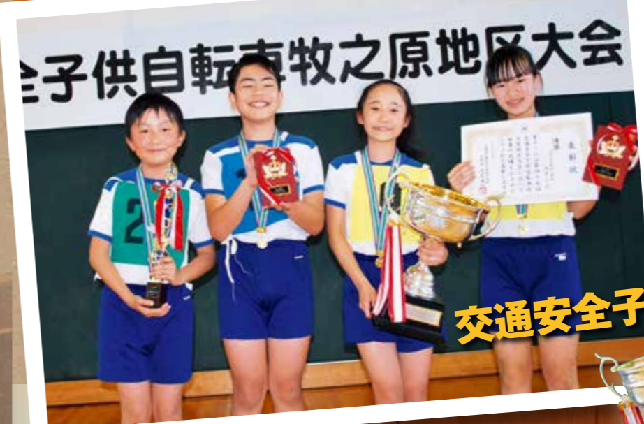
交通安全子供自転車牧之原地区大会