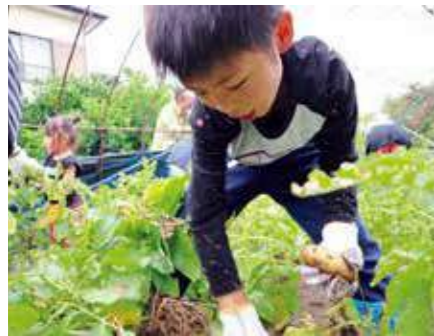
▲軍手をはめ次々とジャガイモを掘り起こす参加者。「じゃがバターにして食べたい!」