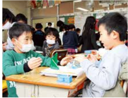
▲新入学児と1年生が折り紙を折って作った紙相撲で楽しく交流