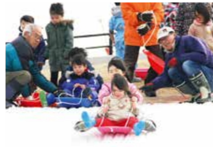
▲子どもたちは珍しい雪に大はしゃぎ。命山の斜面で何度も繰り返し楽しんだそり滑り

県営吉田公園で2月2日から3日間、園内に整備した命山を活用した雪遊びのイベントが催され、訪れた親子連れなどが珍しい雪の斜面でそり滑りなどを楽しみました。「命山の存在を知ってもらい安心して公園を訪れてほしい」と指定管理者のNPOしずかちゃんが町内外から27の企業や団体、個人の協賛を得て初めて企画。静岡県井川などから10トンドンプカー9台分の雪が運び込まれ、命山の斜面に雪を敷き詰めると小さなゲレンデが登場。子どもたちは長さ40mの雪の斜面を何度も繰り返し滑り降り、歓声を上げながら雪遊びを満喫しました。