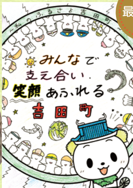
賞品としてよし吉のぬいぐるみとピンバッジのセットをプレゼント。

吉田町の未来のことを考えながら、毎日少しずつ描きましたの仲間は、子どもも大人もみんな仲が良い吉田町が好きなので、いろんな人が手をのびないで支え合っている絵を描きました。