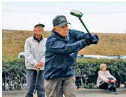
▲グループの仲間と楽しみながら熱い戦いを繰り広げる参加者