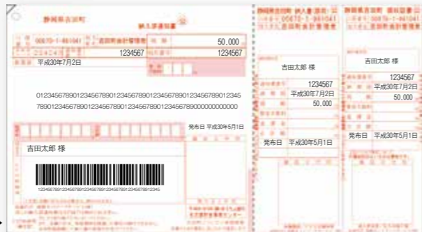
新しくなった納付書の例(町県民税)▶

4月発行分からコンビニ収納用バーコード入りの納付書に変わります。水道料金と下水道使用料は、一括して1枚の納付書に。納期限を確認し、期限内に納付してください。今まで通り役場や金融機関でも納付することができます。