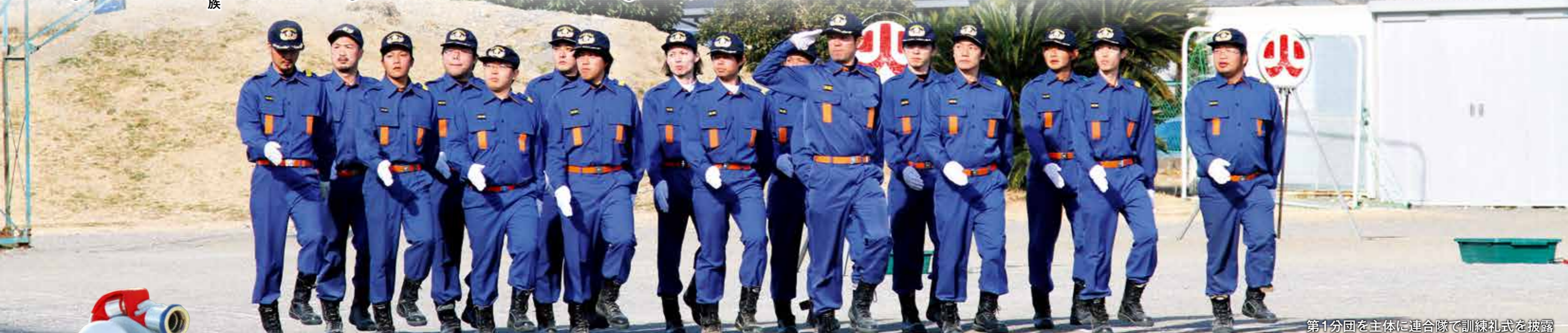
第1分団を主体に連合隊で訓練礼式を披露