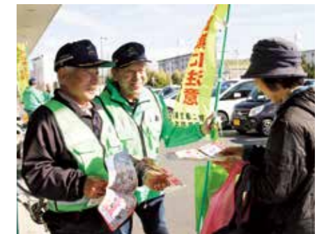
▲パンフレットや絆創膏を手渡し、特殊詐欺の被害防止を呼びかける参加者

防犯の日に合わせて1月15日、川尻区自治会は同区内のスーパー前で防犯キャンペーンを行いました。参加した自治会役員や地域安全推進員、榛南防犯協会メンバーなど11人は、オレオレ詐欺などの「だましの手口」を紹介したパンフレットや絆創膏を配布しながら、買い物客に「サギ電話に気を付けて」と未然防止を訴えました。牧之原警察署によると、管内では昨年中に特殊詐欺被害が3件発生。同署は「サギ電話は息子や孫を語って複数回掛かってくる。知らない人からの電話は必ず疑い、確認や相談してほしい」と呼びかけています。