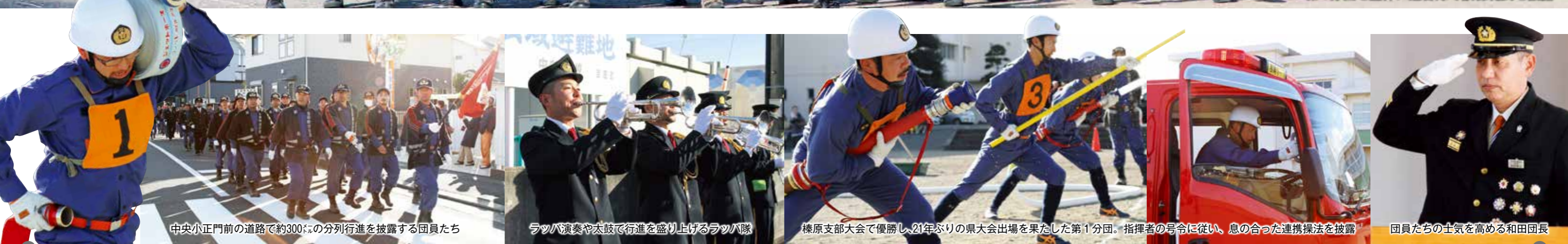
中央小正門前の道路で約300名の分列行進を披露する団員たち