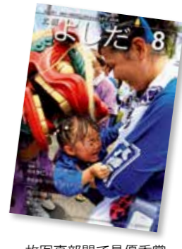
一枚写真部門で最優秀賞2017年8月号の表紙 / 川尻八幡津島神社夏季例大祭での一コマを撮影。