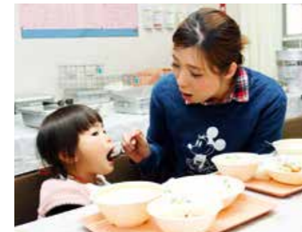
▲調理風景など会場内を見学した後、試食の学校給食を味わう来場者