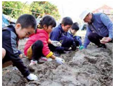
▲スタッフの手ほどきを受けながらジャガイモの植え付けに挑戦する子どもたち