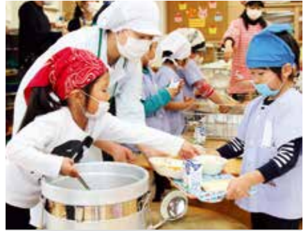
▲栄養教諭から配膳の仕方を教わりながらおかずを上手に取り分ける園児たち