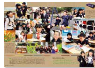
組み写真部門で最優秀賞を受賞した2017年5月号2・3ページ / 小学校の入学式で撮影した子どもたちの笑顔を組み写真に。