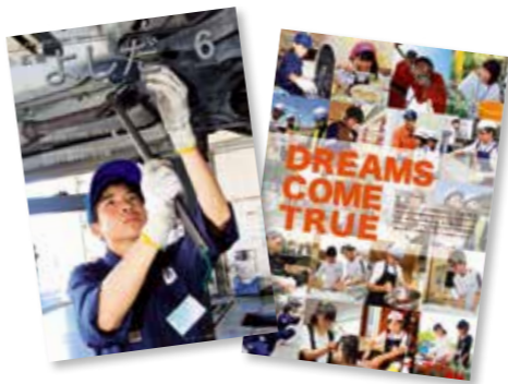
広報紙で優秀賞を受賞した2017年6月号 / 夢をテーマに吉田中学校の職業体験と夢を叶えた大人たちを特集、風揚げ大会など。