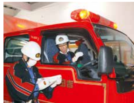
▲夜警の出発の前に、メーター類の作動やライトの点灯など気を引き締めて車両点検