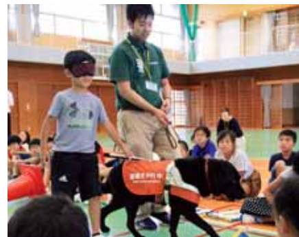
▲アイマスクを着けて盲導犬との歩行を体験する児童