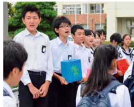
▲手作りの募金箱を手に、正門で募金を呼び掛ける生徒会役員たち