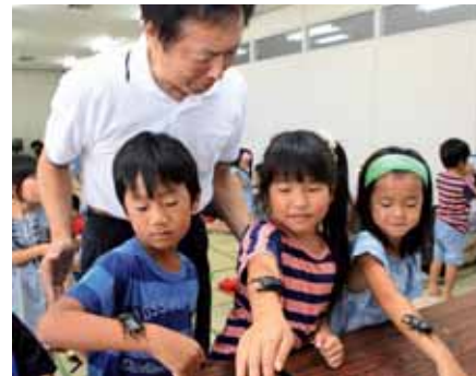
▲オオクワガタを腕の上に乗せながら観察する子どもたち