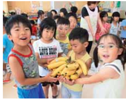
▲大きい台湾バナナの房を抱えてうれしそうな園児たち