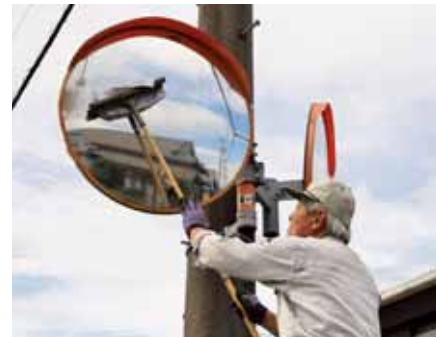
▲脚立に登り、カーブミラーをピカピカに磨く交通安全会役員