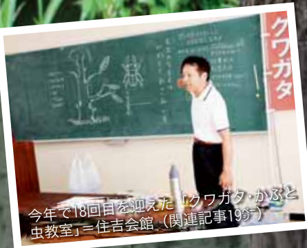
今年で18回目を迎えた「クワガタ・かぶと虫教室」=住吉会館。(関連記事193)

1958年4月8日生まれ、住吉在住。59歳。父、母、妻、娘3人の7人家族。現在は矢崎計器(株)島田事業所に勤務し、収益改善推進部でグローバルに活躍。無類のペコちゃん好きで、集めたペコちゃんグッズは3,000点を超えるほどのコレクター。