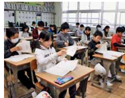
▲テストを前に、担任の先生から注意事項など説明を受ける児童