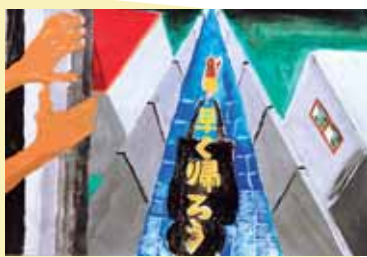
しらいまこ (吉田中2年) 「早く帰ろう」