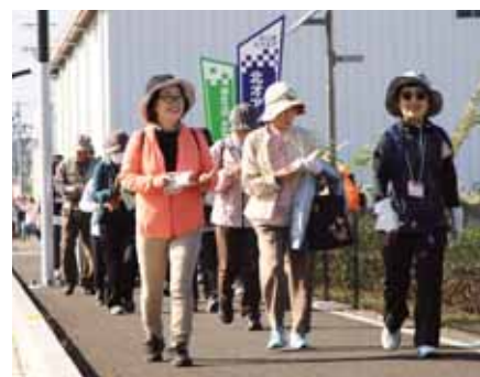
▲チェックポイントでクイズに答えながら楽しんだウォーキング