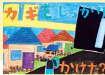
あさいあなほ 浅井菜々帆 (中央小6年) 「カギをしっかりかけた？」