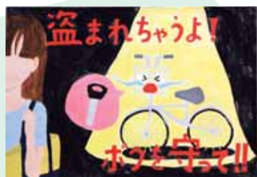
おだほのか (吉田中3年) 「盗まれちゃうよ ポクを守って」