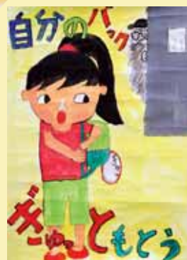
みよい なな (自彊小5年) 「自分のバッグ ぎゅっともとう」