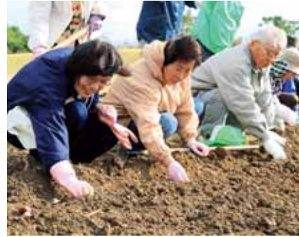
▲クワやシャベルを使って土を掘り、丁寧に球根を植えていく参加者

県営吉田公園で11月23日～12月11日、来春のチューリップまつり開催に向けてチューリップの植栽が行われました。期間中、町内外から職場仲間や家族連れなど約300人が参加し、60品種約10万球の球根を植え付けました。参加者は球根を植える向きや深さなど、公園スタッフの指導を受けながら一つ一つ丁寧に植えていました。花壇のデザインは黄、オレンジ、ピンク色を中心に万華鏡をイメージ。八重咲きのイエローポンポネットやユリ咲きのバレリーナなど珍しい品種も多数植えられ、来年4月上旬には満開のチューリップ畑が訪れる人たちを出迎えます。