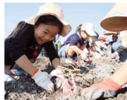
▲大きなさつまいもを見つけ、いもの周りを手で掘って丁寧に収穫