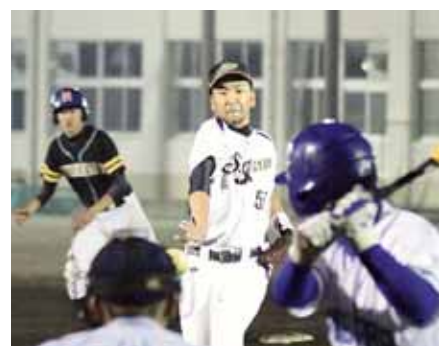
▲見事な投球で相手の打者を抑える下片岡I・CLUBのピッチャー