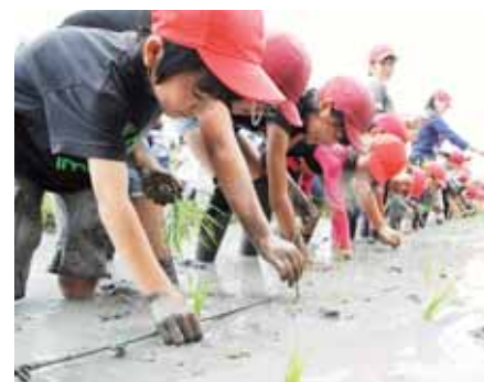
▲下級生は上級生に教わりながら「大きくなあれ」と丁寧に苗を植え付け