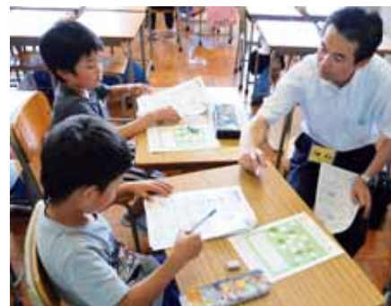
▲個々の課題に応じたプリントが用意され、グループごとに講師が指導