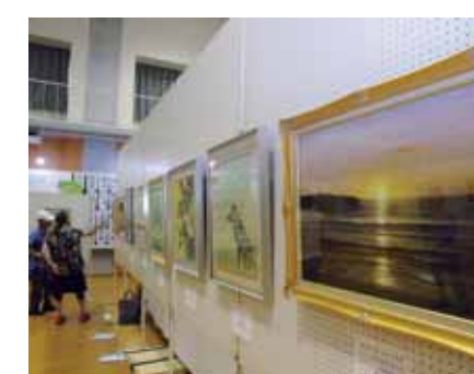
▲地域住民自慢の作品がずらりと並んだ片岡区ふれあい文化展