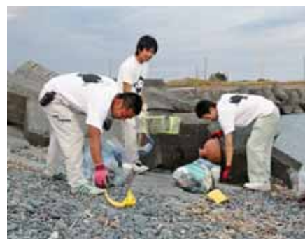
▲吉田漁港周辺でゴミ拾いに汗を流す商工会青年部員たち