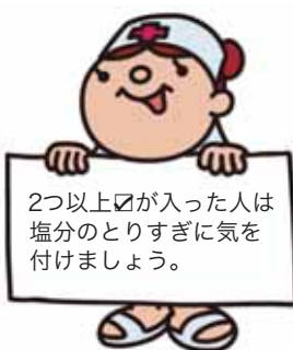
2つ以上が入った人は塩分のとりすぎに気を付けましょう。

一人一人に合ったアドバイスもしています。まずは自身の生活を振り返ることから始めてみませんか。