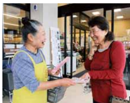
▲啓発品を手渡ししながら食育や減塩の大切さを呼び掛ける食推協メンバー