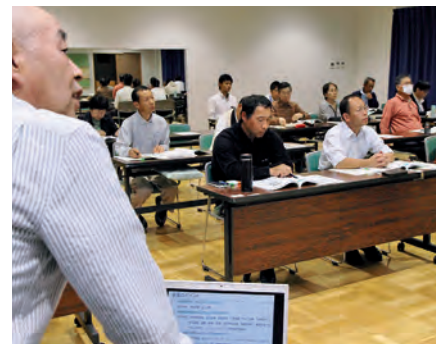
▲地域防災指導者養成講座を真剣な表情で受講する参加者