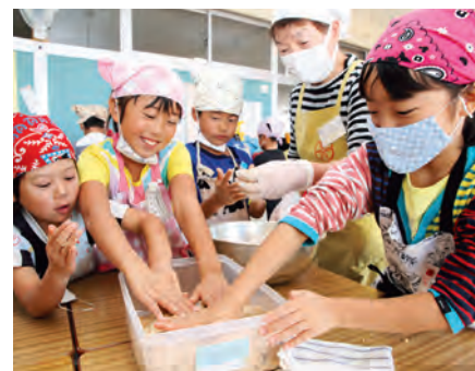
▲塩と糶を混ぜた大豆を保存用の容器にびっしりと詰めていく児童