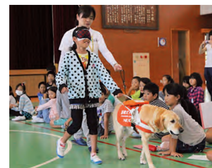
▲アイマスクを着けて盲導犬との歩行を体験する児童