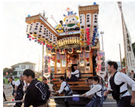
▲町のPR部長「よし吉」をかたどった山車を引き回す祭り参加者

最終日夕方からは、神社の境内で舞踊や地踊りなどが披露され、見物客から大きな拍手と歓声を送られました。祭り参加者は2日間元気に屋台を引き回し、楽しみながら地域の絆を深めていました。