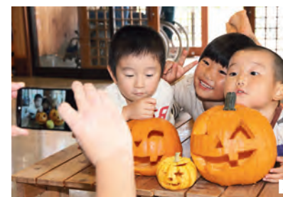
1 芝生広場に植えられた深紅のコスモスが来場者をお出迎え 2 ジャックオーランタン作りでカボチャの中身を一生懸命くりぬく参加者 3 親子で作ったジャックオーランタンを前に記念撮影