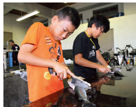
▲包丁を使い、慣れない手つきでニジマスのウロコを落としていく参加者