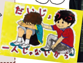
受賞した作品『だじょうぶ一人じゃない』