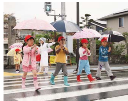
▲傘を両手でまっすぐ持ち、グループごと横断歩道の渡り方を学ぶ児童