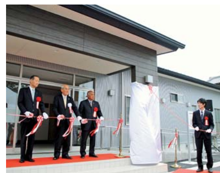
▲「吉田町神戸コミュニティ広場」の完成を祝い、テープカットする出席者