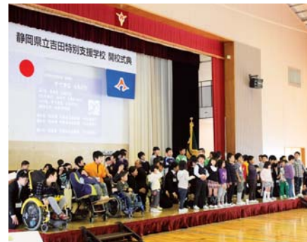
▲式典のオープニングで、開校を祝い愛唱歌を合唱する小学部児童