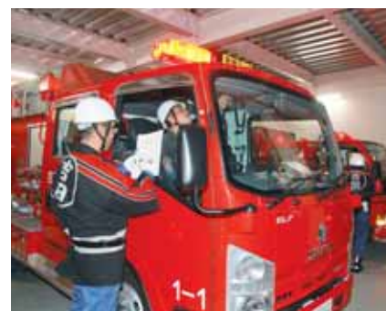
▲夜警出発前に気を引き締めて車両を点検する第一分団の団員たち