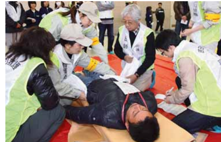
▲吉田中体育館で実施した医療救護訓練で「トリアージ」に挑戦する参加者

吉田中体育館で実施した医療救護訓練では、地域住民や医療関係者らが災害発生時の救護体制や役割を再確認しながら、けが人の負傷程度を把握して治療の優先度を決める「トリアージ」に挑戦。榛原総合病院へ傷病者を搬送する手順も確認しました。