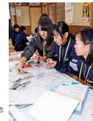
▶住吉森下地区ではタウンウォッチングで危険箇所を確認し、防災マップを作成