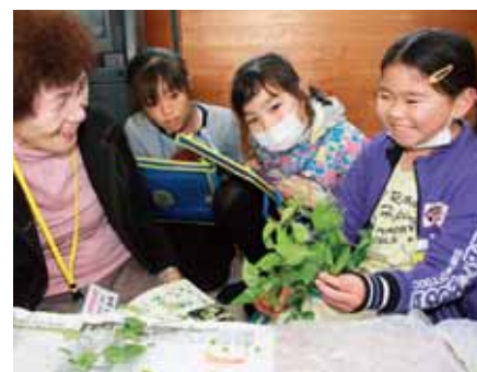
▲湯日川周辺の植物に触ったり匂いを嗅いだりして野草に親しむ児童