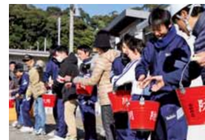
▲バケツリレーで消火訓練を体験