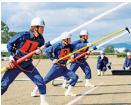
▲日ごろ重ねた訓練の成果を発揮し、自己ベストを目指して競技する消防団員