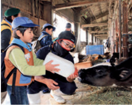
▲大きな哺乳瓶で生後1カ月の子牛にミルクを飲ませる子ども