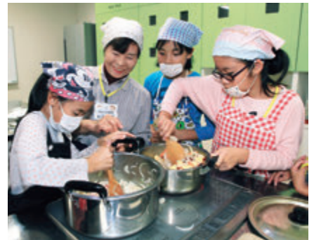
▲涙を流しながら切ったタマネギ、ニンジン、ジャガイモなどを炒めてカレー作り

2日目の学校終了後は、グループごとスーパーに買い出し。それぞれが予算の範囲内で材料を用意し、オリジナルのカレー作りに挑戦しました。3日目は林泉寺で座禅を体験するなど、グループごと協力して行動する力を養い、学年を超えて交流を深めました。