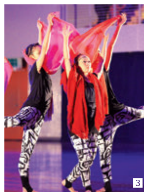
1 総踊りでは息を合わせて元気よく演技 2 新曲演技「吉田祭り～ソイヤの風～」を初披露 3 趣向を凝らした衣装とダンスで妖艶に