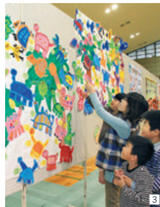
1 日ごろの練習の成果を思い切り表現した芸能祭 2 懐かしんで足を止め、昔話に花を咲かせた文化協会50周年記念の「今昔写真展」 3 多彩な作品がずらりと並んだ文化展