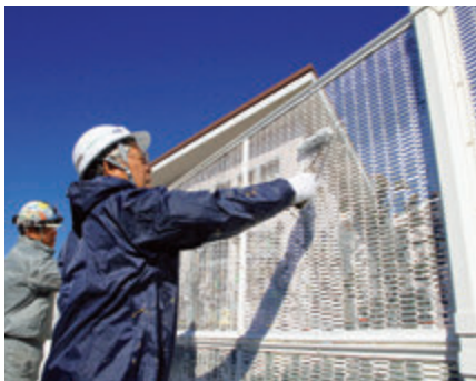
▲へらを使って塗装を剥がし、ローラーで丁寧にペンキを塗り替える組合員