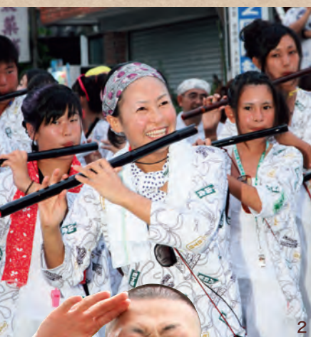
1_華麗に装飾された山車を威勢良く引き回す当番組の皆さん(左:森下組、右:山八組) 2_山車の後ろで太鼓に合わせ、軽快に笛の音を響かせる参加者 3_十二の尊の子どもたちと戯れる獅子 4_行列を先導し「わっしょい、わっしょい」と小学生が元気よく担ぐ小神輿 5_豪快な掛け声とともに重い道具を担いで勇ましく練り歩く奴士6_水を掛けて奴士をねぎらう監督 7_お渡りを前にお母さんに真っ赤な紅を引いてもらってお稚児さん 8_舞台での披露を終えたかわいい踊り子さんのオフショット