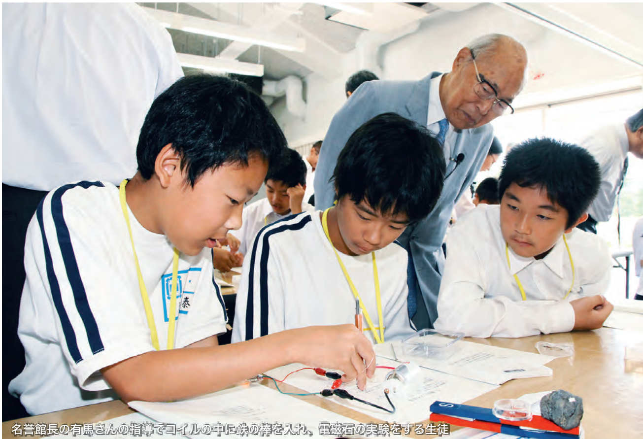
名誉館長の有馬さんの指導でコイルの中に鉄の棒を入れ、電磁石の実験をする生徒

1989年東京大学総長、1998年に参議院議員・文部大臣などを経て、現在は静岡文化芸術大学理事長を務める