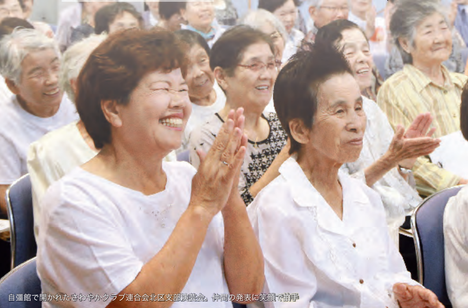
自彊館で開かれたさわやかクラブ連合会北区支部演芸会。仲間の発表に笑顔で拍手

分の趣味を楽しみたい」「少しでも誰かの役に立ちたい」「いつまでも自分らしくいきいきと暮らしたい」は誰もが考える願いなのではないでしょうか。 年齢とともに視力や筋力が衰えていくのは仕方ないこと。しかし、食生活にちょっと気を付けたり簡単な体操を続けたりすることで病気や寝たきりの予防につながります。健康を維持することで、はつらつと年を重ねることができるようです。趣味や仕事は日常を彩る大切な要素の1つ。毎日いきいきと生活し、活躍している人はたくさんいます。生きがいを見つけ、充実した人生を送っている人はキラキラと輝いています。 そんな人たちが集う「元気で長生き」の町を目指してー。