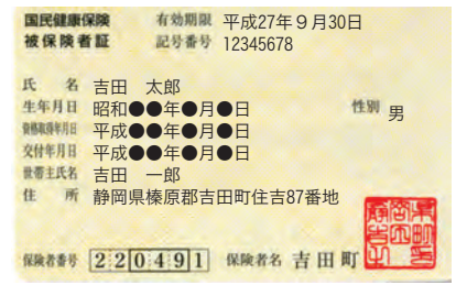
※保険証の裏面に臓器提供の意思表示が記載できますので利用してください。