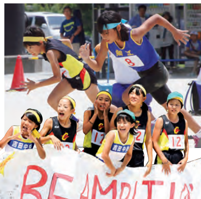
▶仲間の競技を精いっぱい応援