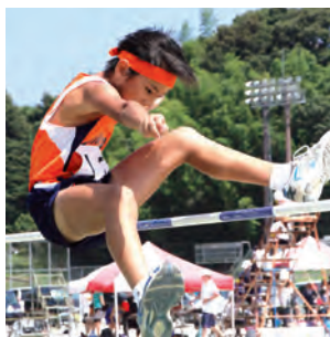
▲自己ベスト記録を目指して男子走り高跳び