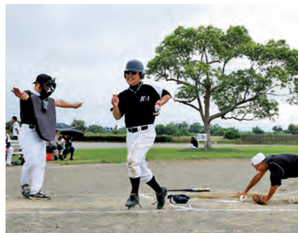
▲白熱した試合の中でも楽しみながら親睦を深めたソフトボール大会

大会の結果は次の通り。▷優勝/中原下▷準優勝/向原、下川原▷第3位/宮前・大溝・谷川東、東青柳・上川原