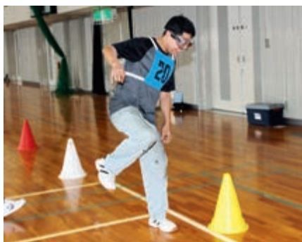
▲泥酔状態を疑似体験できるゴーグルを着用し、会場内の特設コースを歩く参加者