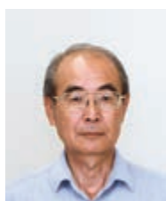
いわくら ともみ 岩倉 具視 (住吉)