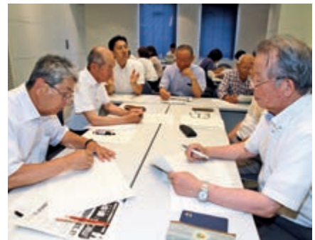
▲認知症による徘徊の課題や対策について意見を交換し合う参加者

最初に町が高齢化率や認知症高齢者数など現状について説明。町地域包括支援センターは、どうして徘徊するのかなどを説明し「地域で見守りが必要」と呼び掛けました。その後、参加者は6グループに分かれ、徘徊対策について意見を交換。「隣近所に徘徊の恐れがあることを知らせておく」「各事業所でマニュアル作成が必要」など意見が交わされました。