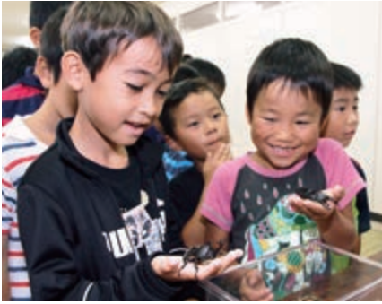
▲クワガタやカブトムシを手の上に乗せて観察し、うれしそうな参加者