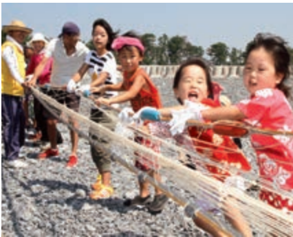
▲元気よく声を掛け合い、力を合わせて網を引き上げる子どもたち