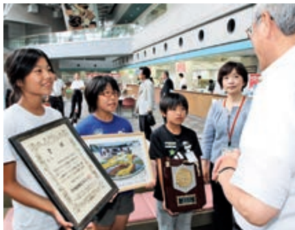
▲受賞花壇の写真を見せながら、田村町長に受賞報告をする園芸委員会の児童