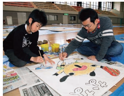
▲和紙を骨組みに貼り合わせてから、親子で真剣に色塗りをする参加者