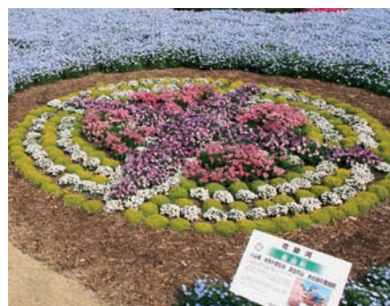
▲町章をかたどり、メネシアやアリッサムなど鮮やかな花で彩られた吉田町の花壇

吉田町の花壇は町章をかたどり、町の名所や特産物のウナギ、シラス、レタスの色彩をイメージして町花の会が作製。メネシアやアリッサムなどで彩られています。そのほか、会場内には「花みどりアート回廊」や世界初の「青い胡蝶蘭」など見どころが満載。6月15日まで開催しています。