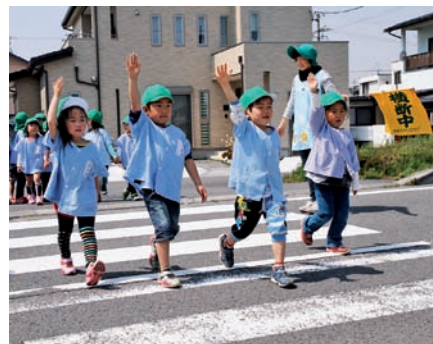
▲真っすぐに元よく手を上げ、グループごと横断歩道の渡り方を学ぶ園児ら