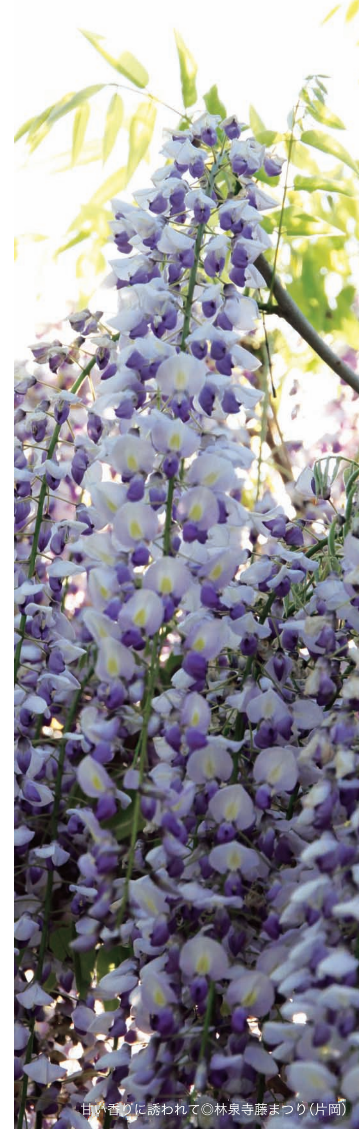
甘い香りに誘われて◎林泉寺藤まつり(片岡)