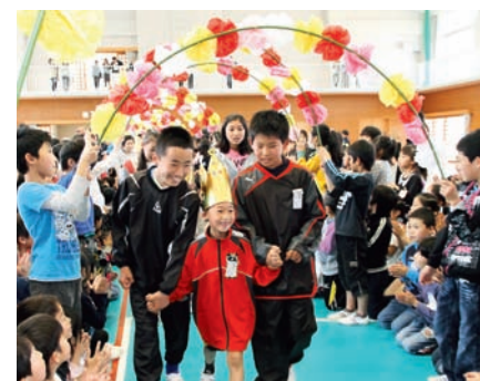
▲新1年生はベアの6年生と手をつなぎ、花のアーチをくぐって会場へ