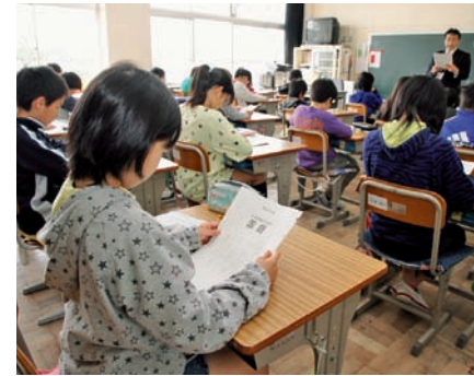
▲テストを前に担任の先生から注意事項など説明を受ける児童