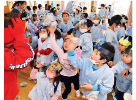
▲「鬼は～外！」と鬼に向かって豆に見立てて丸めた新聞紙をぶつける園児

そのうち、さくら保育園ではホールに園児たちが集まり、豆まきの歌やクイズで節分について学んだ後、鬼の面と衣装を着けた職員が続々と登場。園児たちは、豆に見立てて丸めた新聞紙を「威張り鬼」や「泣き虫鬼」などに向かって力いっぱい投げつけ、鬼を追い払いました。