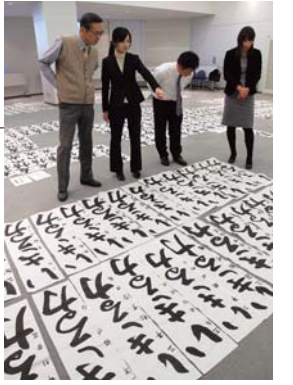
▲出展された力作を審査

1月10日に役場町民ホールで開かれた審査会では、各学校から集まった代表作品271点を、書写担当教諭が「止め」や「はらい」、バランスなどを一点ずつ審査し、82点の入賞作品（町長賞各学年1点、教育長賞各学年2点、特選55点）を決定しました。結果は次の通りです。（町長賞・教育長賞のみ掲載、敬称略）