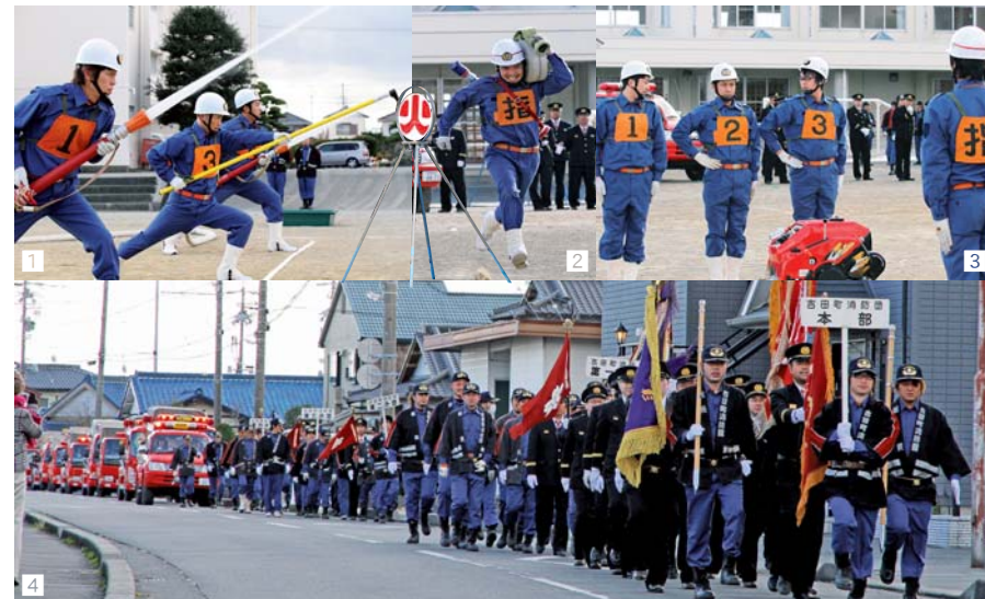
1 指揮者の号令に合わせ、機敏な動作でポンプ車操法を披露する3分団 2 3 小型ポンプ操法を披露する2分団 4 消防車両10台とともに小学校前をパレードし、火の用心を呼び掛ける団員

一人一人であるという覚悟を持ってもらいたい。町民の期待に応えるよう、今後とも士気を高め、訓練に励んでほしい」と訓示しました。 そのほか、長年にわたり消防団活動に従事した団員の表彰も行われ、田村町長や安田消防団長から表彰状や感謝状などが手渡されました。