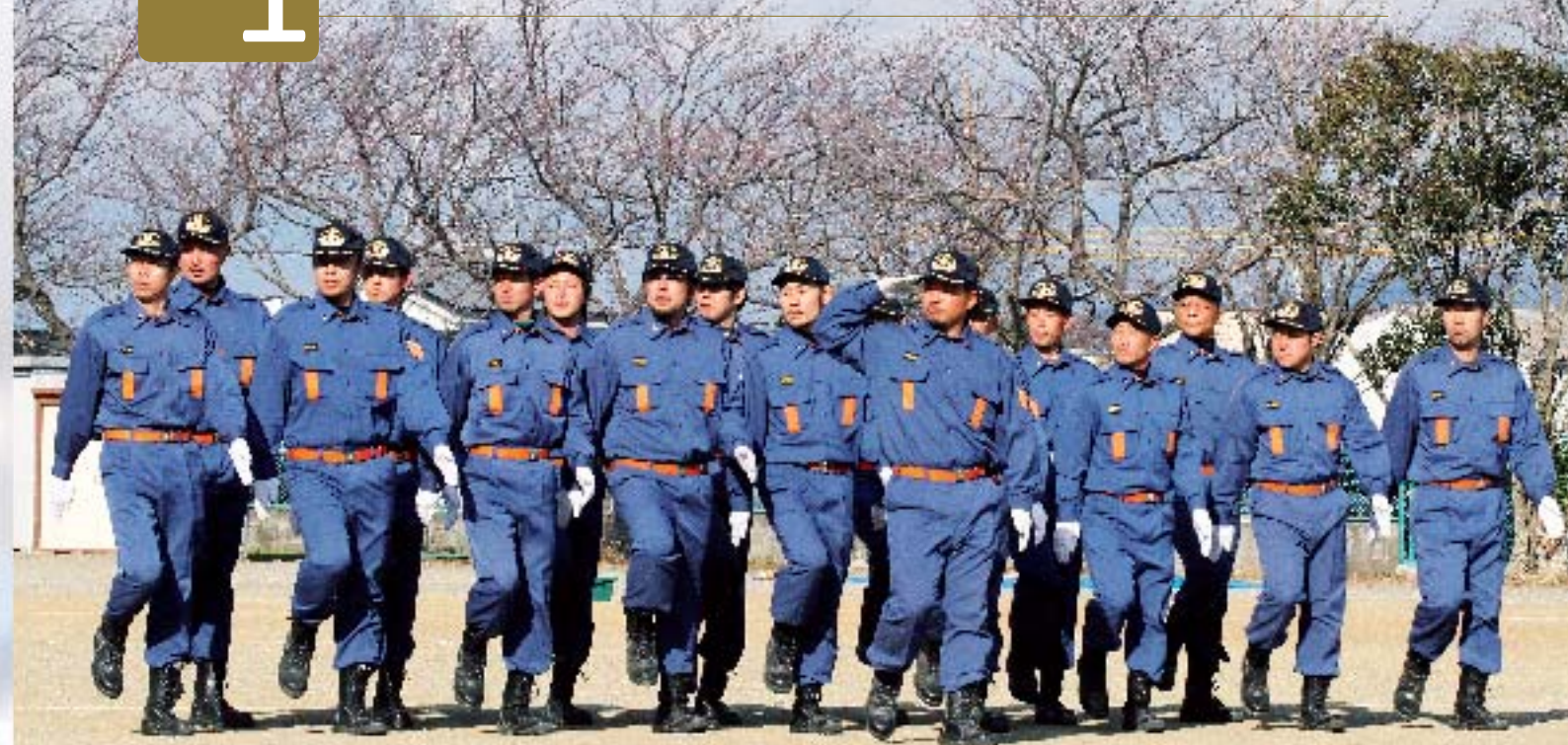
訓練礼式で日ごろの訓練の成果を披露する消防団員ら