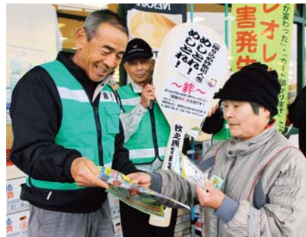
▲しゃもじとパンフレットを配布し、振り込め詐欺防止を呼び掛ける自治会役員