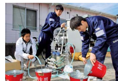
▲災害用の浄水装置を使い、汚い水を飲み水に変える作業を体験