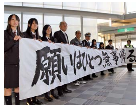
▲作製した横断幕を掲げ交通安全を呼び掛ける吉田高校生徒