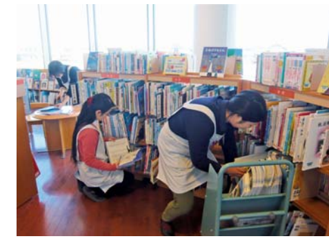
▲1冊1冊丁寧に確認する蔵書点検の様子

2月17日(月)から24日(月)は『蔵書点検』のため休館します。『毎年長い間休館して何をしているの?』と疑問に思っている人もいるかもしれません。そこで、今号は『蔵書点検』の内容について紹介します。 『蔵書点検』は、町民の皆さんの大切な財産である蔵書が無くなつていないか、実際に資料がある場所と目録データが一致しているかを確認します。図書館にとって非常に大切な作業です。