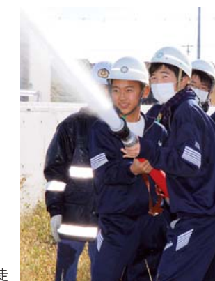
▶消防団による放水訓練に参加する吉中生徒