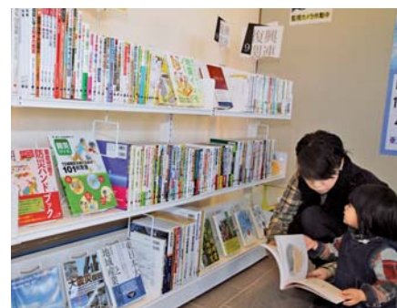
▲絵本を読みながら「津波が来たらすぐ逃げるんだよ」と子どもに話すお母さん