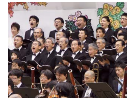
▲オーケストラの演奏に合わせて「よるこびの歌」を熱唱する合唱団

昨年春に結成された総勢130人の合唱団は、5月から月3、4回の練習を重ね、その成果を精一杯「よるこびの歌」に込めて熱唱。「掛川市民オーケストラ」の華麗な演奏に合わせて声高らかに歌い上げると、観客は総立ちになり、沸き起こった拍手はしばらく鳴り止みませんでした。