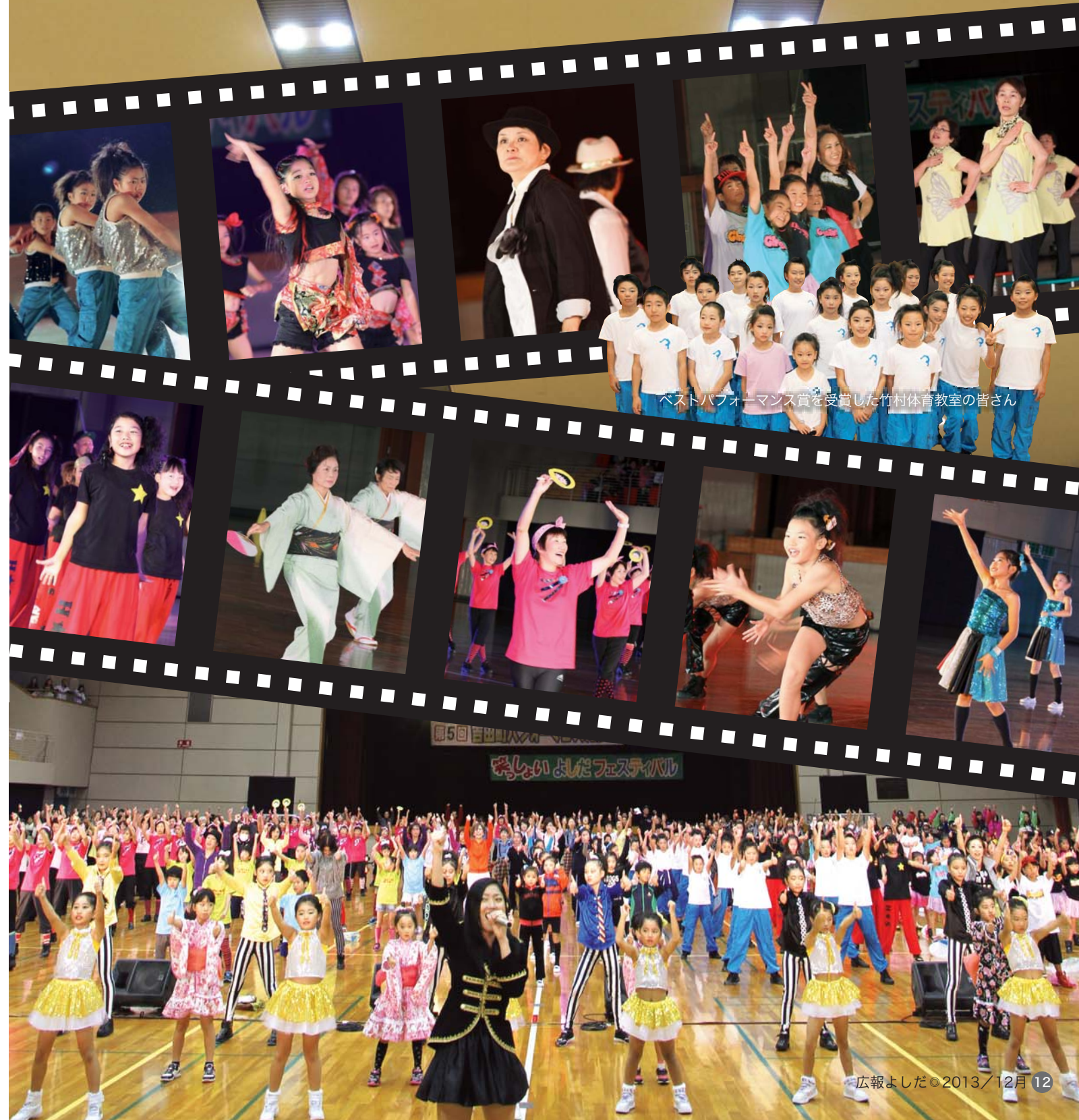
ベストパフォーマンス賞を受賞した竹村体育教室の皆さん

「笑っしょいよしだフェスティバル」（町ダンス・健康づくり推進委員会主催）が11月17日、総合体育館で開かれました。町内外のダンスグループや町内会など子どもからお年寄りまで、幅広い年代の22チーム約400人が、鮮やかなそろいの衣装で息の合った踊りを披露。発表会は「ヤーレコのSAY!」や「遠州吉田かっぽれ」などの課題曲に合わせて踊る「コンテスト部門」と自由な曲目で創作ダンスを披露する「発表部門」があり、出場者たちそれぞれ自慢の演技を元気いっぱい披露しました。