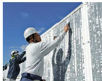
▲ペンキを塗り替える前に、へらを使ってフェンスの塗装を剥がす組合員