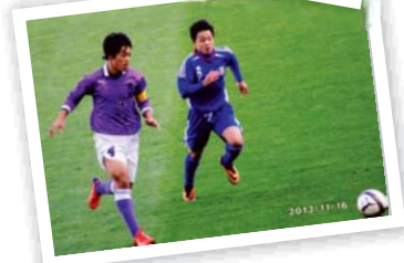
▲全国高校サッカー選手権大会静岡大会決勝戦の様子