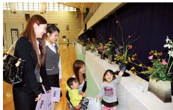
▲書道や華道など自慢の作品がずらりと並んだ文化展

11月2日・3日の両日には「吉田町文化展」が総合体育館で開かれました。会場には、町内保育園の園児や小学校児童、文化協会会員などが制作した絵画や盆栽、写真、書道などの力作約1,000点がずらりと並び、来場者の目を楽しませました。