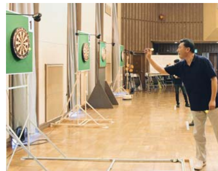
▲練習で鍛えた腕前を披露しようと、真剣な表情で的に向かう参加者

大会の結果は次の通り。▷優勝／藤枝武道館A▷準優勝／ING▷第3位／藤枝武道館B