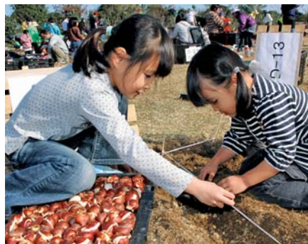
▲ビニールひもに14cm間隔で印を付け、向きをそろえて丁寧に球根を植える参加者