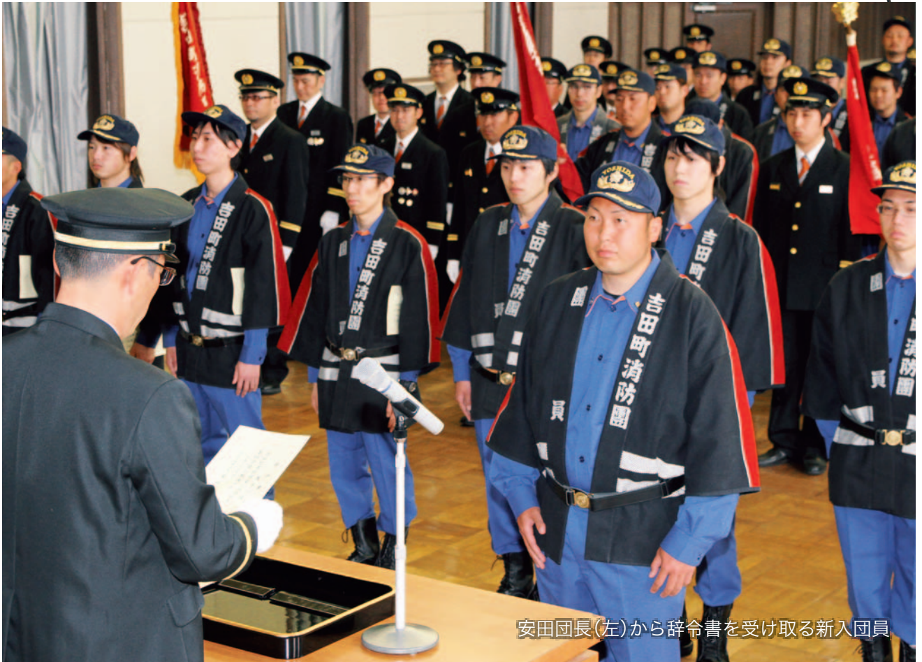
安田団長(左)から辞令書を受け取る新入団員