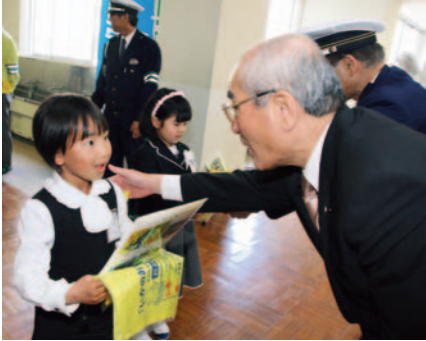
▲新入学児童に優しく声を掛けながら交通安全グッズを手渡す田村町長