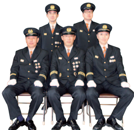
平成25年度 吉田町消防団三役(敬称略)