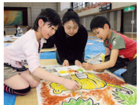
▲かわいい凧を作りたいと家族で協力して色塗りをする参加者

作品は、5月17日まで役場ロビーに展示、5月19日に開催される凧揚げ大会で大空高く揚げられます。