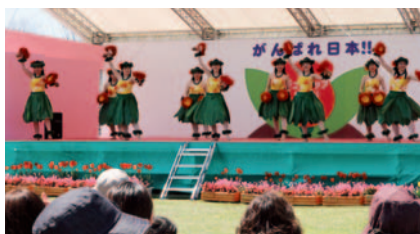
▲特設ステージで会場を盛り上げるフラダンスグループ