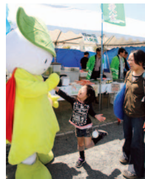
▶町と交流のある八女市も特産品販売でPR。人気を集めたゆるキャラのみどりちゃん