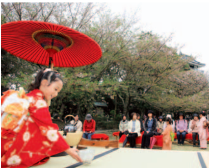
▲特設の茶席でお点前を披露する町文化協会茶道部員