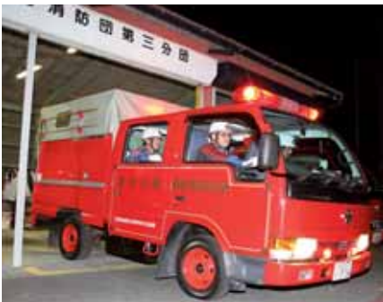
▲気を引き締めて夜警に出発する第三分団の団員たち