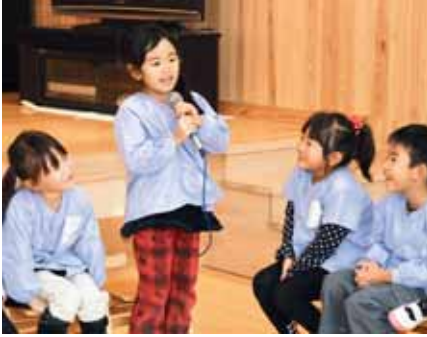
▲自分の名前と将来の夢を1人ずつ元気よく発表する園児たち