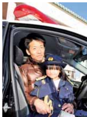
▶会場外にはパトカーの試乗や警察官の制服が試着できる体験コーナーも