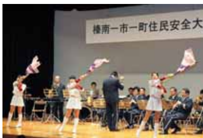
▲県警音楽隊は演歌やポップスなどさまざまな曲を披露