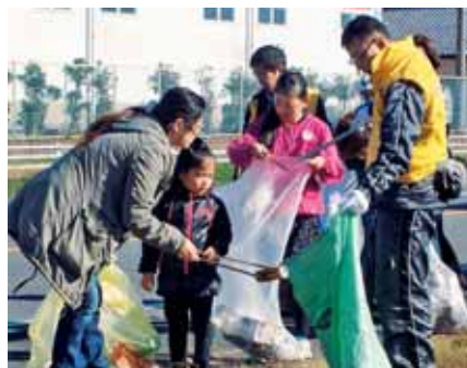
▲家族で仲良く分別しながらごみ拾いをする参加者

同会は、清掃奉仕活動を年に数回実施。「自分たちの町は自分たちの手できれいにする」を合い言葉に、地域内の環境美化と子供たちの健全な育成を目指してこの活動を長年続けています。