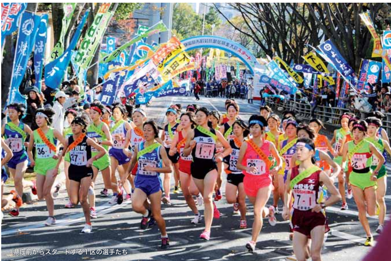
県庁前からスタートする1区の選手たち

県内全35市町から39チーム（市の部27チーム・町の部12チーム）が参加した今大会は、風のないベストコンディションの中、午前10時に県庁前をスタート。選手たちは、ふるさとの誇りと大きな期待を背負い、県営草薙陸上競技場までの11区間、42・195キロを懸命にタスキをつなぎ、熱い戦いを繰り広げました。