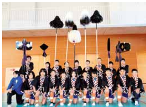
▲整備した道具を身にまとう住吉地区の子どもたち