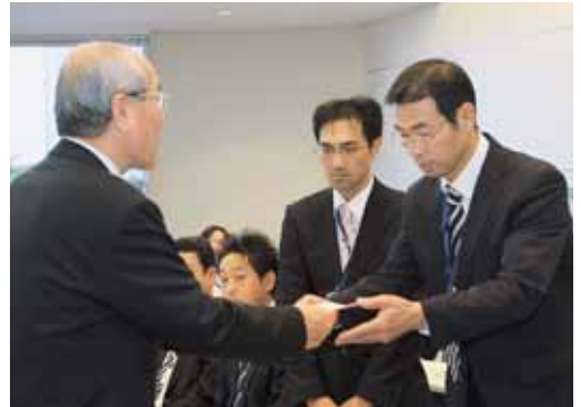
▲田村町長から協力事業所証を受け取る事業者