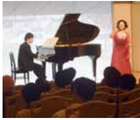
▲平成24年3月19日に行われた親子で楽しむコンサートの様子