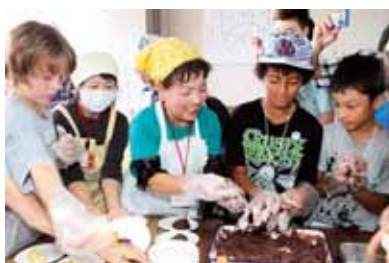
▲餅つきの後は、ついたお餅を丸めてあんこやきな粉のお団子作りに挑戦