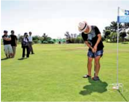
▲チームで団結してプレーを楽しむ参加者