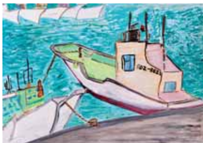
そね だいと 曾根 太登 (吉田中1年)