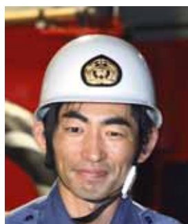
すずき よしひろ 鈴木 全弘 (指揮者)