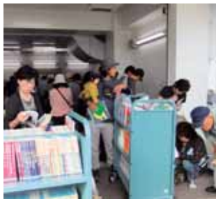
▲昨年の古本市。多くの人々が来場し、さまざまな種類の本を手にしていました。