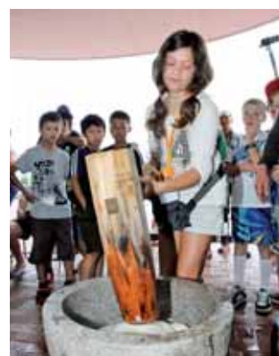
▶初めての餅つき体験。重いきねを振り上げ上手に餅つきをする子ども