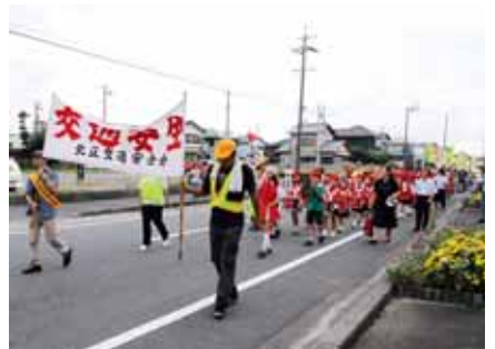
▲自彊小4年生による鼓笛隊が軽快な音楽でパレードを先導

北区交通安全会は9月22日、秋の全国交通安全運動に合わせ「交通安全パレード」を同区内で実施し、自治会役員や自彊小PTAなど約300人が参加しました。出発式で坂本道明会長は「ルールとマナーを守って交通事故を無くしましょう」とあいさつ。パレードは、自彊小4年生54人でつくる鼓笛隊を先頭に、参加者が「飲酒運転追放」や「高齢者を交通事故から守ろう」などのスローガンを書いたのぼり旗を掲げ、日の出地区周辺2.5kmを約1時間かけて行進し、地域住民やドライバーらに交通安全を呼び掛けました。