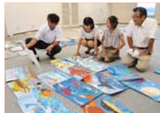
▲並べられた作品を一つずつ審査

9月7日に役場町民ホールで開かれた審査会では、各学校の美術担当教諭が色使いや表現力などを一点ずつ審査し、54点の入賞作品を決定。入賞作品(町長賞、教育長賞、組合長賞のみ)は、「静岡県海の子の作品展」に出品されます。結果は次の通り。(敬称略)