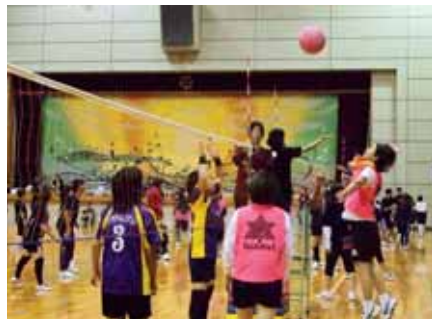
▲例年以上の参加者で熱戦が展開された会場

今年で10回目を迎えた吉田町ソフトバレーボール親睦大会が9月30日、総合体育館で開催されました。この日は、混合の部・女子の部合わせて40チームが参加し、優勝目指してハイレベルな熱戦を繰り広げました。結果は次の通り（各ブロック優勝のみ）。▷【混合の部】Aブロック＝46ERS B・Bブロック＝かよちゃんずー・Cブロック＝FORCE・Dブロック＝Pokaboo Aチーム・Eブロック＝西浜満P.C. D・Fブロック＝46ERS A【女子の部】Aブロック＝REV☆LLA・Bブロック＝コラゾン