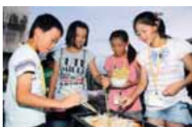
▲自分で作ったお箸を使ってバーベキュー ◀ボランティアの指導の下箸作りに挑戦