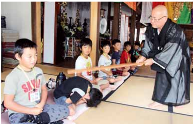
▲能満寺での座禅体験で、住職の警策で気を引き締める子どもたち