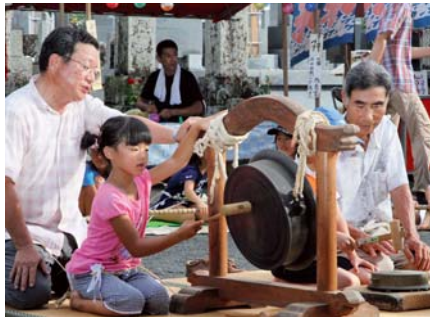
◀悪疫退散を祈願して念仏を唱えながら鐘を打ち鳴らす関係者と参加者