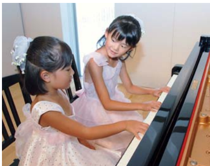
▲2人で仲良くぴったり息を合わせて「キラキラ星」を演奏する出演者