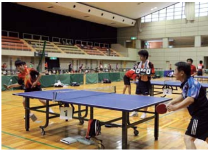
▲開会式同日、真剣な表情でプレーする卓球の選手たち（総合体育館）