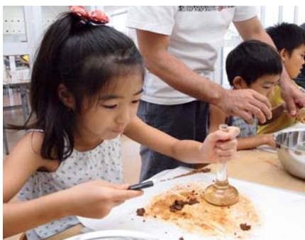
▲赤土と展色材を練り棒で混ぜ合わせる児童