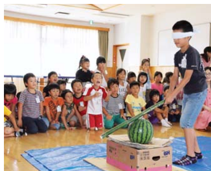
▲友だちの掛け声を頼りに、スイカ目掛けて竹の棒を振り下ろす児童

7月30日、町放課後児童クラブの合同保育が児童館で行われ、約180人の児童がスイカ割りを楽しみました。「前！前！」「もっと右！」という友だちの掛け声を頼りに、タオルで目隠しをした児童が力いっぱい振り下ろした竹の棒がスイカに命中するたびに大歓声。割ったスイカは昼食時に分けられ、児童はやきそばと一緒に味わっていました。合同保育は、普段は別々のクラブに通う小学1～4年生が、夏休み期間中に他学区との交流を図るために実施され、スイカ割りのほかに綱引きや人権擁護委員による講話などさまざまなイベントを楽しみました。