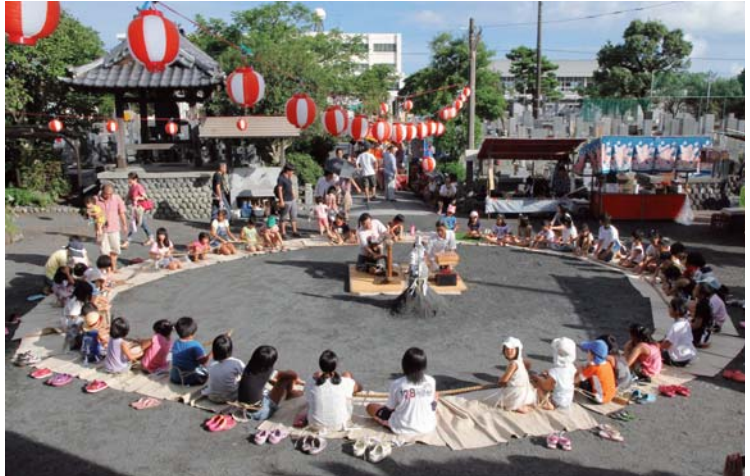
▲「チャンチャコチャー新田堂」と唱えながら輪になって数珠を回す子供たち

8月15日、町指定15号無形民俗文化財指定の「地蔵院の百万遍」が、神戸の地蔵院で行われました。町商工会北区支部は、伝統文化継承のため、本祭りを前に同区内の子どもたちを集めて祭りのゆえんなどを話した後、実際に数珠回しを体験させました。集まった子供たちは、鐘をたたき、輪になって、「チャンチャコチャー新田堂」と元気よく唱えながら大数珠を回して安全祈願。300余年も続くこの伝統行事は、元禄初年に流行した悪病を退散するため、村人たちは辻堂に集まって7日7夜鐘を打ちながら「チャンチャコチャーなんまいだ」と数珠を百万遍回して祈願しました。それから簡略化されてはいるものの毎夏の恒例行事として現在も引き継がれています。麻のひもに直径4～5釐ほどの玉約1,050個が通された大数珠は直径8釐。数珠回しの回数を数える計数盤や香盤なども昔のままの形で残っています。