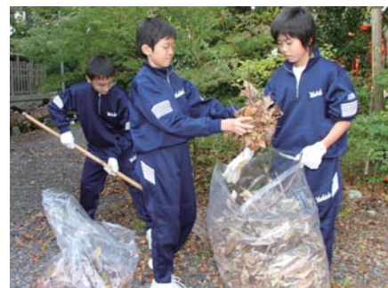
▲住吉神社境内の落ち葉拾いに汗を流す吉田中学校の生徒ら