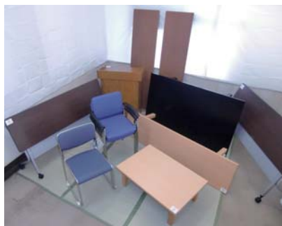
▲片岡下町内会が宝くじの助成金で整備したテーブルや会議椅子などの備品