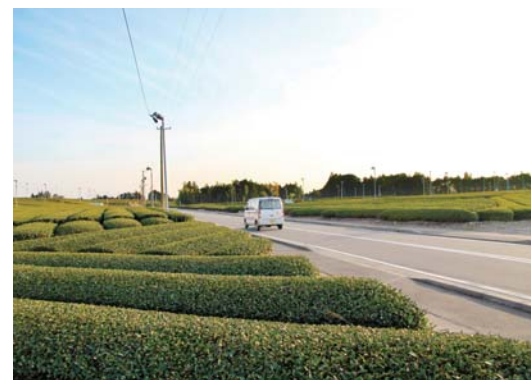
▲沿道に広がる茶園