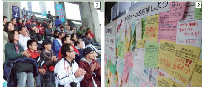
1 過去最高順位となる4位に入賞し、喜びを見せる選手と実行委員ら / 2 総合体育館に設置されたパネルには多くの応援メッセージが寄せられた / 3 力走する選手に熱い声援を送る吉田町からかけつけた応援団の皆さん

●大会結果(町の部入賞のみ) ①長泉町▷2時間23分11秒 ②函南町▷2時間23分35秒 ③小山町▷2時間23分52秒 ④吉田町▷2時間24分10秒 ⑤森町▷2時間24分54秒 ⑥松崎町▷2時間25分09秒