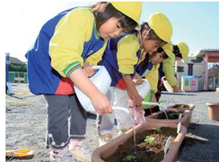
▲自分で植え込んだ場所に願いを込めながらじょうろで水を掛ける園児