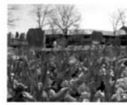
高床式の花壇・レイズドベッドのエリアには、心癒す花の香りが漂っています。