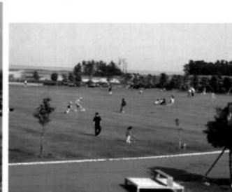
芝生広場A 吉田公園最大の広さを誇る芝生広場です。親子が触れ合う絶好のエリアです。