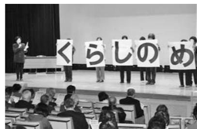
寸劇を披露した消費者グループ松の会

のを食べ、家族そろって楽しく食事をすることが大事、子どものころに幅広く食べ物を食べた経験を持つことは大切、親の生活のすべてが子どものお手本となり、親の姿を無条件でまねをする。」と強調されました。会場の皆さんは、笑いの中にも食育の重要性を実感した様子でした。ロビーにおいては、同協議会に加盟している女性団体の日ごろの活動報告や手づくりの作品展、アルミ缶、古切手、牛乳パックの回収、地場産品の販売、リサイクルバッグや手作りみそ配布などが行われ、にぎわいをみせていました。