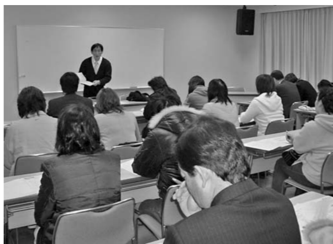
講師の話に耳を傾ける参加者の皆さん（川尻会館）

者が指導できるようにすることで、子どもに確かな学力と学習習慣を身に付けさせようと、昨年度に引き続き実施されました。講座には、延べ60人の方が参加し、子どもたちが楽しみなながら算数・数学を勉強できる工夫などを学びました。