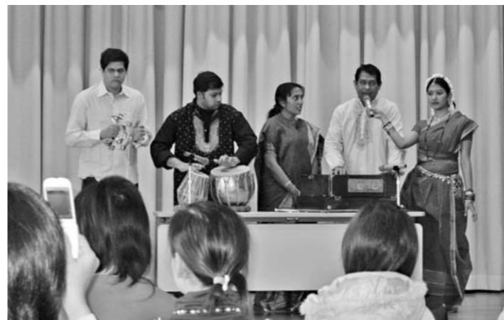
バングラデシュの音楽と舞踊を披露した「Uttoron」メンバー

ユの各種料理による会食も行われました。会食は立食形式で行われ、参加者の皆さんは、本場のカレーなどを味わいながら、さまざまな国の出身者と交流することができ、異文化交流の楽しいひとときを過ごしました。