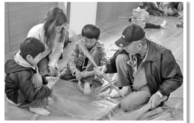
お正月飾り作り (12月15日)