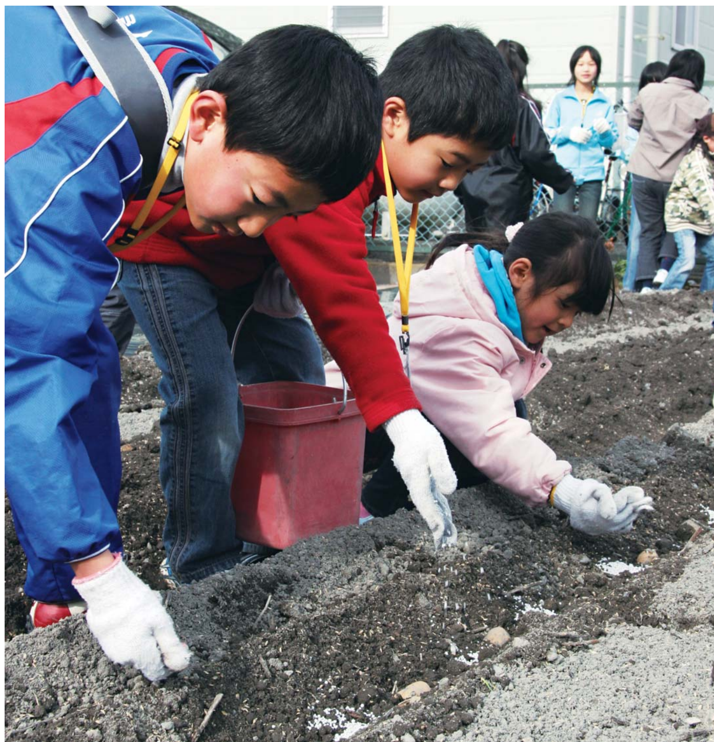
ふるさと学級・ジャガイモ植え（2月9日）