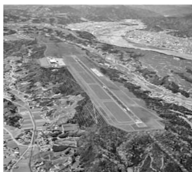
富士山静岡空港完成イメージ図