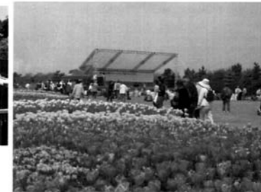
芝生広場B(チューリップ植栽地) このエリアは、毎年4月になると、数万球のチューリップが咲き誇り、訪れる人を楽しませます。

緩やかなスロープの滑り台は、ちびっこの大人気です。最上部からは、園内が一望できます。