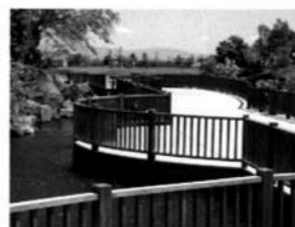
花の道 メダカ泳ぐ小池に架かる木橋を過ぎると視界が開け、駿河湾の風が頬を優しくなでています。