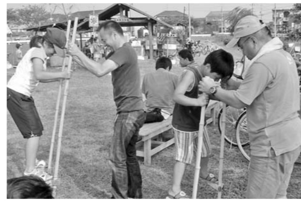
七夕祭り&花火大会 (8月5日)