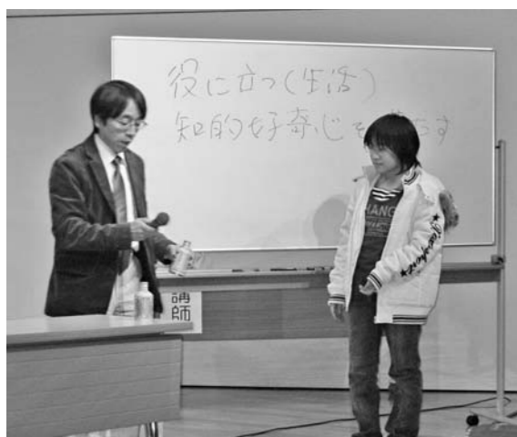
空き缶などを使った実験に挑戦しました

え、「私たちは、なぜ理科を学ばなければならないのか」という内容で講演していただきました。また、町教育委員会より平成22年度開館予定の「ちいさな理科館」の施設整備方針などについて説明がありました。