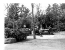
やすらぎの庭 木陰で鳥のさえずりをBGMに、やすらぎの一時を過ごしてみませんか。