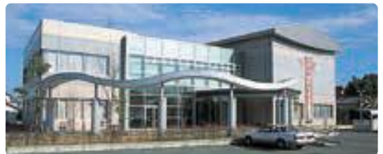
▲川尻会館 かわかん