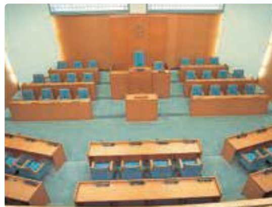
▲吉田町役場(4階 議場) ぎじょう