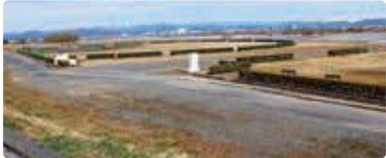
▲高島スポーツ広場(川尻・大幡) たかしま かをしり おおはた