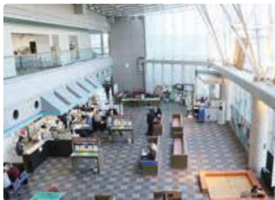
▲吉田町役場(1階 ロビー) かい