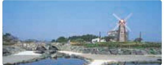
▲湯日川親水公園(住吉) ゆい しんすい すみよし