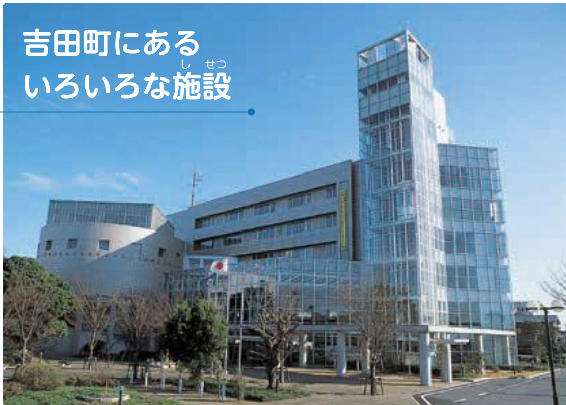
▲吉田町役場(全景) やくば ぜんけい