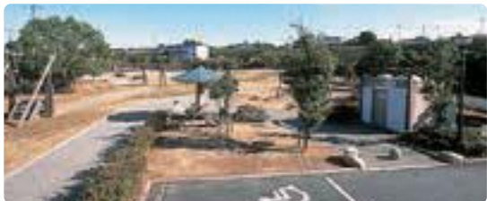
▲青柳公園(神戸) あおやぎ かんどう