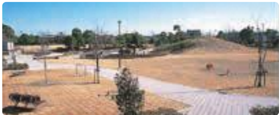
▲西の宮公園(川尻) にし みや かんどう