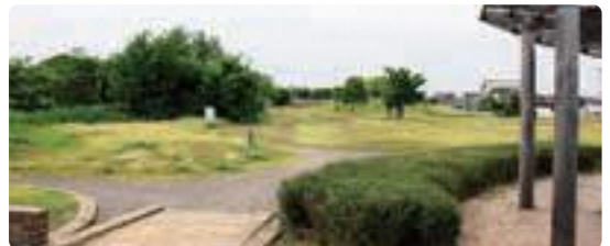
▲小藤路公園(住吉) ことろじ すみよし