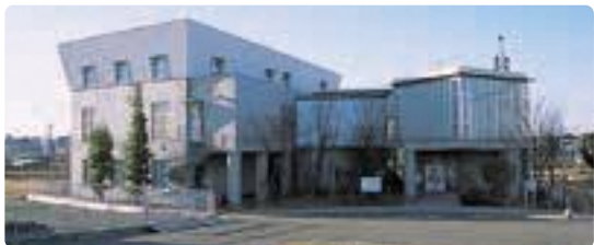
▲北区自彊館(神戸) きたく じきょうかん