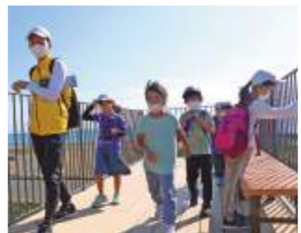
▲地域教育推進協議会スタッフ引率の下、町内をウォーキング。水防センターで寄り道

4地区合同地域教育推進協議会は11月5日、歩いて地域を巡る「ファミリーウォーク」を開催しました。穏やかで温かい秋晴れとなった当日は同協議会スタッフの引率の下、親子連れなど約50人が心地よい風を感じながらウォーキングを楽しみました。コースは中央公民館を発着点とし、川尻海岸防潮堤で折り返しながら西の宮公園、県営吉田公園、湯日川親水公園など町内の公園を巡るコース。高さ11.8mの防潮堤に到着した子どもたちは水防センターに立ち寄り、「景色がきれい」「風が気持ちいい」と駿河湾などの眺望を楽しんでいました。