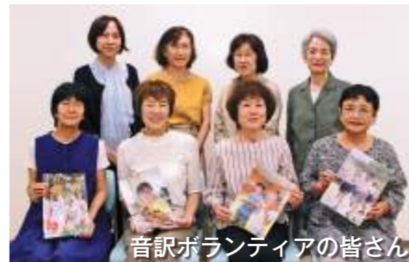
音訳ボランティアの皆さん

平成11年に設立してから20年以上、視覚障害者のための録音資料作成に携わり、町の地域福祉の向上に貢献。これまで「広報よしだ」や町文化協会が発行する「文集よしだ」の音訳作業を行ってきました。現在はメンバー8人が交代で月1回、約6時間活動しています。受賞を受けて「身に余る光栄でもとても感激。私たちの声で多くの情報を正確に届けられるよう、努力していきたい」