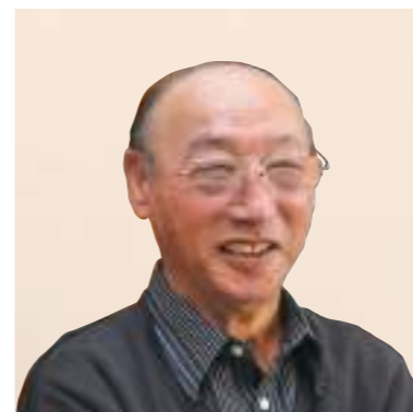
元日本郵政 公社職員