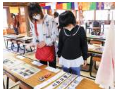
▲記録展に訪れ、戦時中に集団疎開した子どもたちの暮らしを学ぶ親子