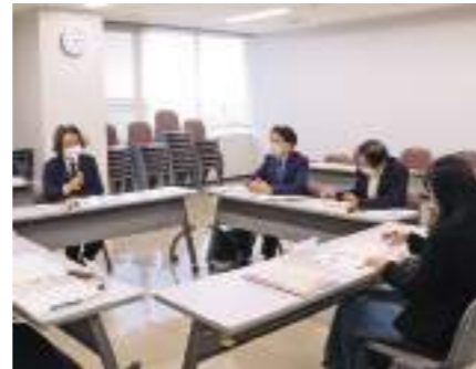
▲町からの報告を受け、子どもの学力向上の課題について議論する教育委員

町は11月14日、総合教育会議を町役場で開き、三者共益を目指して実施している「TCPトリビンスプラン」の取り組み状況を教育委員に報告しました。教職員と保護者を対象に行ったアンケート調査では、プランについて肯定的な意見が多数という結果が示されました。会議では、町からの報告を受けて取り組みを継続していくことを確認。一方で全国学力調査の平均正答率が県平均を下回った現状への対策として、委員からはICTを効果的に活用した授業改善を更に進めることや家庭学習の充実、外国籍の子どもに対する支援の充実を求める声などがあがりました。