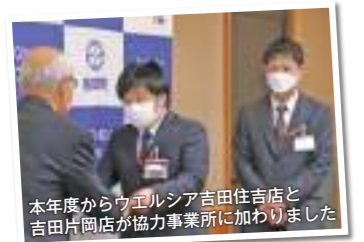
本年度からウエルシア吉田住吉店と吉田片岡店が協力事業所に加わりました