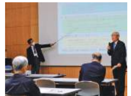
▲スクリーンを使って参加者に、次期総合計画の施策のイメージについて説明

令和6~13年度のまちづくりの指針を定める第6次総合計画に町民の皆さんの意見を反映させようと、町は11月12日・19日に各地区でタウンミーティングを開きました。ミーティングには4地区合わせて約70人が参加。町から第5次総合計画の進捗や10月に行った住民意識調査の結果、次期計画における施策のイメージについてスクリーンを使って説明しました。意見交換の場では、参加者から治水対策、温室効果ガスの削減、交通の利便性向上、にぎわいの創出などに関する意見があがっていました。