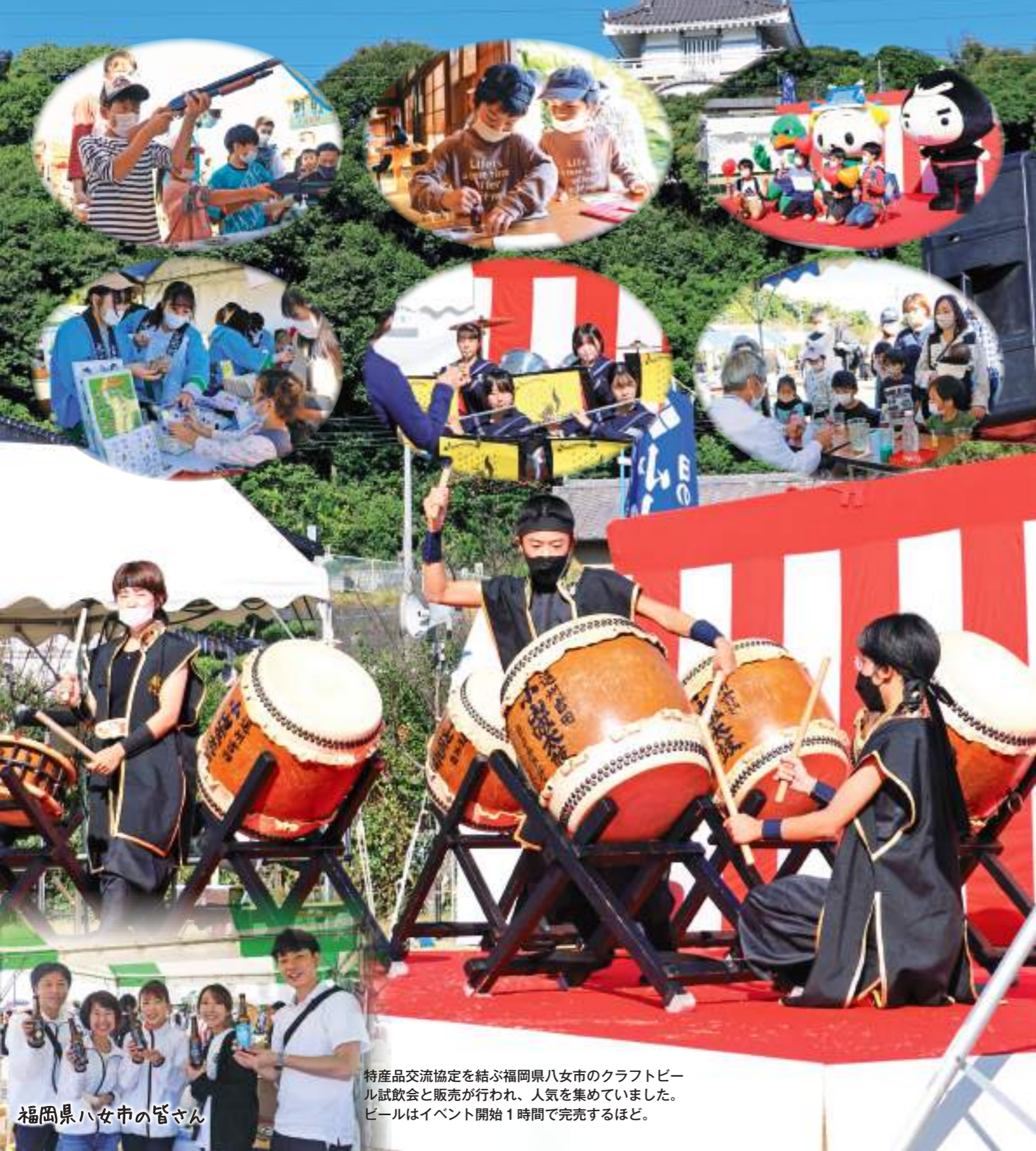
特産品交流協定を結ぶ福岡県八女市のクラフトビール試飲会と販売が行われ、人気を集めていました。ビールはイベント開始1時間で完売するほど。

第 36回小山城まつり（町観光協会主催）が11月3日、小山城前広場・能満寺山公園で3年ぶりに開かれ、秋の休日に多彩な催しを楽しむ大勢の人でにぎわいました。会場では86店のテントが軒を連ねた物産展やフリーマーケット、お楽しみ抽選会などのイベントがにぎやかに繰り広げられました。ミニステージでは、遠州吉田小山城太鼓保存会、吉田中学校吹奏楽部による演奏やよし吉、ウレシ丸、蹴っとばし小僧（藤枝MYFC）が登場するなど、会場を盛り上げました。今年は、小学生以下限定の餅投げやスタンプラリー、紙芝居パフォーマー人形によるパフォーマンスなど子ども向けイベントも充実していました。